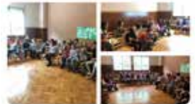
21:41 - 07 maig 19 - Twitter for iPhone

3r de Primària fem l'Eucaristia de Pasqua i acabem amb una acció de gràcies tots connectats!