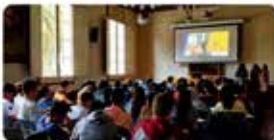
12:50 - 07 maig 19 - Twitter Web Client

"Podem canviar el món les nostres decisions de consum?" Els alumnes de 3r d'ESO seguim investigant aquest repte. Amb la xerrada de @serveisolidari sobre els diferents projectes solidaris d'@escolapiacat coneixem de 1a mà la realitat i ens ajuda en la nostra recerca #SUMMEM #ESO