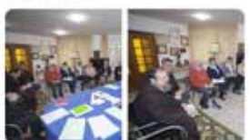
Explicació Barcelona 1.8 mils 12:25 - 06 maig 19 - Twitter Web Client

Aquest mes de maig, ha tingut lloc la trobada biennal entre la junta de la #URC i els bisbes de Catalunya. S'ha plantejat els reptes de la reestructuració de la #vidareligiosa i com contribuir a erradicar la cultura de l'abús sexual, econòmic, de poder i de consciència.