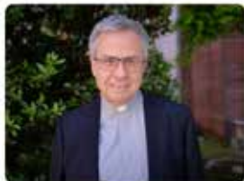
Stabat de Girona 1.5 mils 22:52 - 04 maig 19 - Twitter for Android

El papa Francesc ha nomenat el capellà gironí Joan Planellas i Barnosell arquebisbe metropolità de Tarragona, en substitució de Mons. Jaume Pujol @PujoJaume. Desitgem que la seva tasca de pastor de l'Església de #Tarragona sigui un reflex de l'amor de Déu a tot el poble.