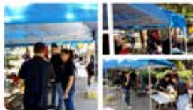
12:34 - 05 maig 19 - Twitter for Android

Joves dels projectes d'inserció col·laboren a la Cultura va de Festa fent el dinar. #LCVDF19 @Bcn_NouBarris @Cultura9b @dulseta @JuanfraTB @ivanzul @ToniParrilla