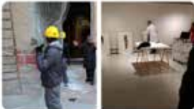
12:35 - 07 maig 19 - Twitter Web Client

Dia intens de muntatge a #Montserrat amb #JaumePlensa L'escultura "Anna" ja pren forma, prèvia a la instal·lació a l'atri de la basílica. I també l'exposició de gravats al Museu Inaugurem divendres 10 de maig!