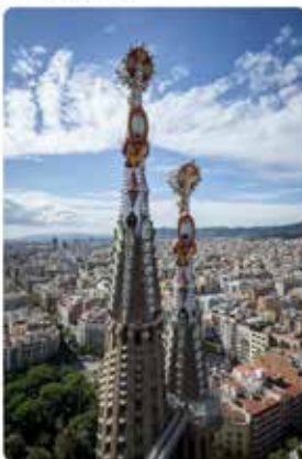
10:27 - 08 maig 19 - Twitter Web Client

Els raigs de sol fan brillar els pinacles situats al capdamunt de totes les torres.