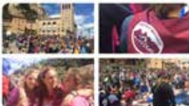
16:13 - 04 maig 19 - Twitter for iPhone

La família #marista a #Montserrat! #pelegrinatgemaista Comunió i germanor.