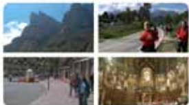
9:00 - 07 maig 19 - Hootsuite Inc

Satisfets i orgullosos d'haver format part de la 42ª pujada a peu a Montserrat! Convivència, germanor, superació i natura, bon resum de l'experiència. Gràcies a tots els participants per fer-ho especial! #Papam2019 #300LaSalle #25anysFundacióComtal #Junts#ReescrivimFutur