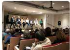
19:25 - 06 maig 19 - Twitter for iPhone

Aquesta tarda, a l'última sessió del curs del cicle dels #DillunsDH, escoltem les demandes de les entitats socials de Barcelona de cara a les #eleccionsmunicipals2019, i les respostes i propostes dels principals partits polítics.