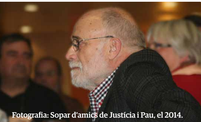
Fotografia: Sopar d'amics de Justícia i Pau, el 2014.