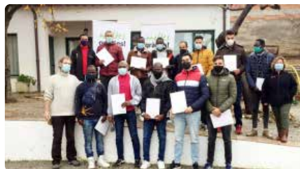
El Xiprer organitza el segon curs per formar laboralment joves sense papers DM, 6/04/2021 | EL 9 NOU