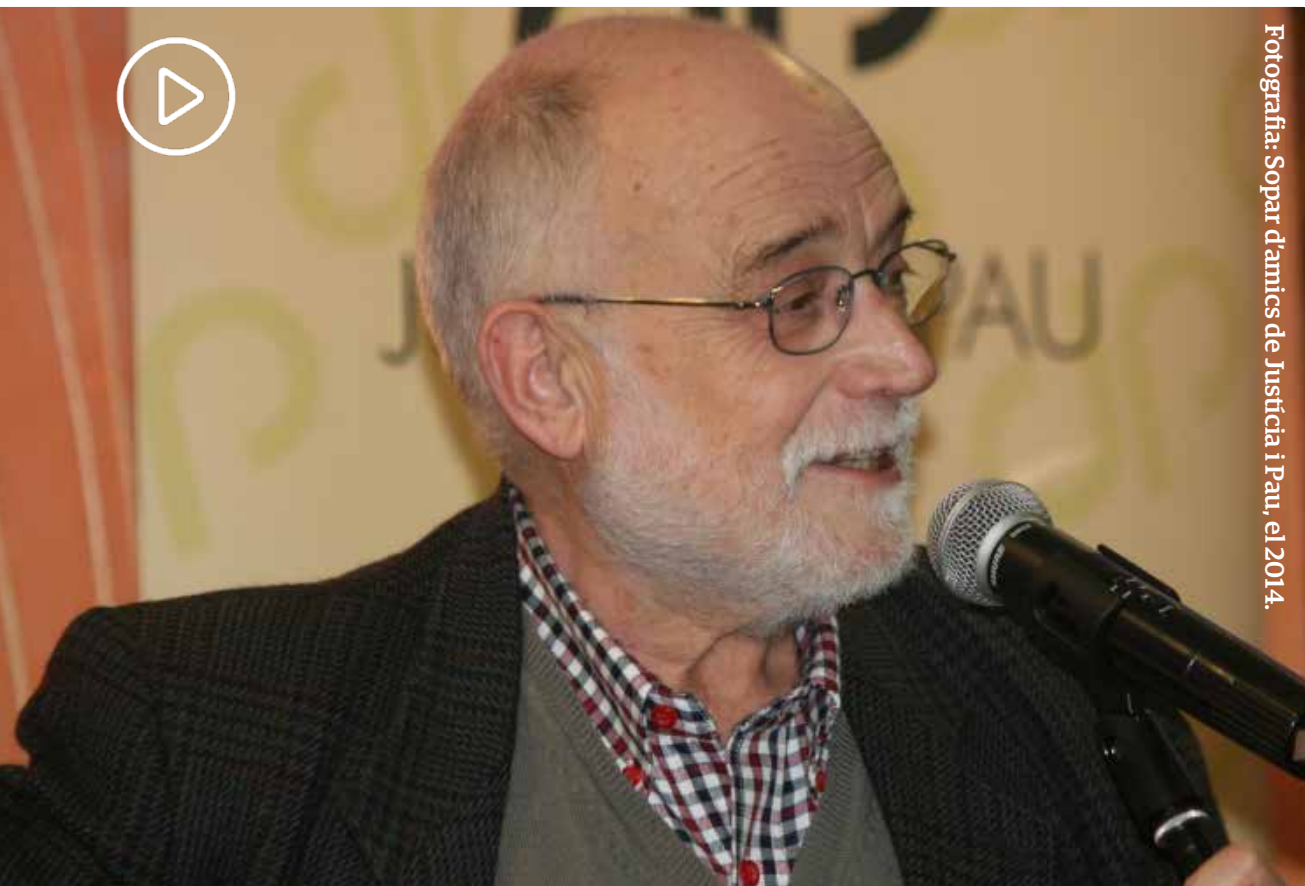
Fotografia: Sopar d'amics de Justícia i Pau, el 2014.