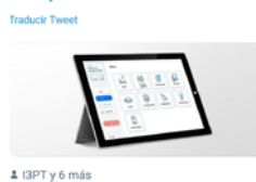
12:40 - 09 abr. 21 - Twitter Web App