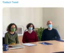
17:29 - 23 mar. 21 - Twitter for Android

Avui ens ha visitat l' @apovns , analista de la OCDE experta en educació. Hem compartit interessants reflexions sobre el temps educatiu, la millora de les escoles i l'acompanyament docent. La seva expertesa internacional ens ha obert la mirada. Gràcies!