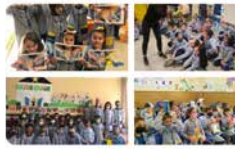
17:14 - 08 abr. 21 - Twitter Web App