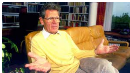
Mor Hans Küng, el teòleg que va qüestionar la infalibilitat del Papa DC, 07/04/2021 | EL PAÍS