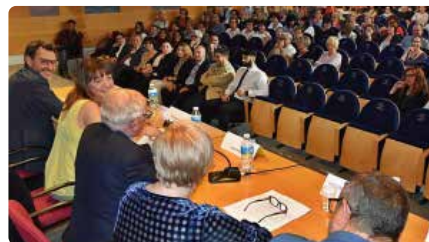
El Casal d'Europa convidarà a Berga el poble italià d'on és originari el Corpus Christi DM, 6/04/2021 | REGIÓ 7