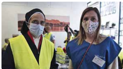
Més de 2.500 usuaris de la plataforma d'aliments de Manresa són fruit de la crisi actual DLL, 05/04/2021 | REGIÓ 7