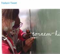
19:31 - 05 abr. 21 - Twitter for Android

Ep! Que hi tornem! Amb energia per encarrar el darrer trimestre Amb ganes de retrobar-nos i seguir-vos acompanyant Amb il·lusió, flexibilitat i rigor BONA TORNADA a tothom! #escolapropera #escolaoberta #vedrunamoltaprop #tornada