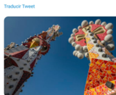
13:28 - 06 abr. 21 - Twitter Web App

Gaudi va desenvolupar un llenguatge propi en el món de l'arquitectura. Una mostra la trobem en el seu interès a plasmar formes orgàniques corbades, la qual cosa el va portar a la innovadora tècnica del trencadís, un dels seus segells més personals