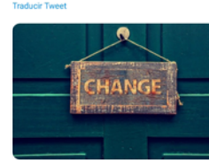
20:05 - 08 abr. 21 - Hootsuite Inc.

"Ens hem adaptat a tantes coses durant l'últim any... Ara Déu ens demana que també canviem el nostre cor, que creem un demà diferent, que tornem a créixer i esdeguem millors després de tot el que hem après de la pandèmia". Recés d'Espai Sagrat. ow.ly/MSGv50Ed5Va