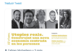
9:42 - 09 abr. 21 - Twitter Web App

Acte en línia: cristianismejusticia.net/directe