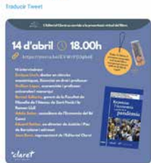
10:01 - 09 abr. 21 - Hootsuite Inc.