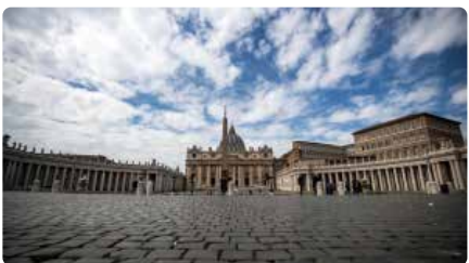
El papa Francesc insta a accelerar la distribució de les vacunes DM, 6/04/2021 | EL PUNT AVUI