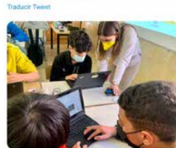
14:30 - 06 abr. 21 - Metricool

Benvinguts al 3r trimestre! Ens retrobem amb energia per seguir compartint la nostra #passioxeducar en la recta final. Ens esperen encara molts aprenentatges, sorpreses i bons moments compartits! Esteu a punt per continuar creixent i gaudint del nostre projecte #avuixdemà2024 ?