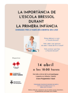
Fundació Pere Tarrés i Ajuntament Santpedor 13:24 - 07 abr. 21 - Twitter Web App