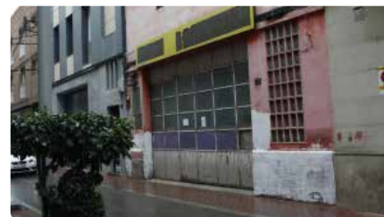
La comunitat islàmica de Lleida obrirà un oratori al carrer Nord per a un centenar de persones DC, 7/04/2021 | SEGRE