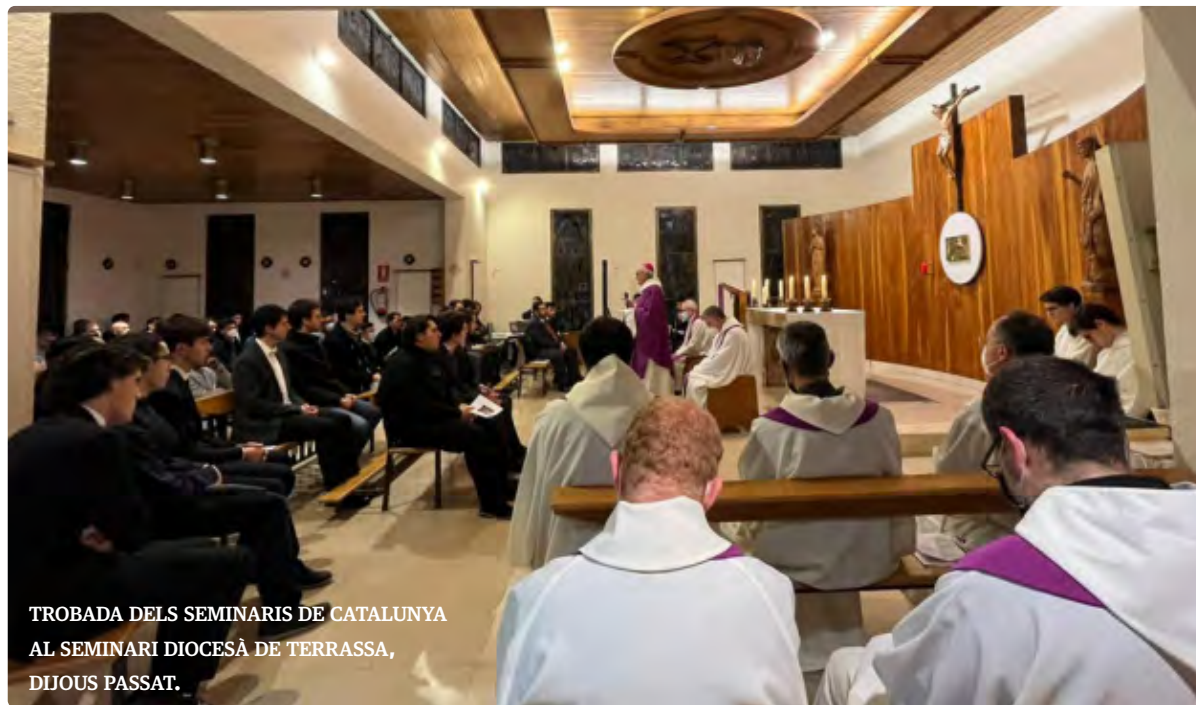
TROBADA DELS SEMINARIS DE CATALUNYA AL SEMINARI DIOCESÀ DE TERRASSA, DIJOUS PASSAT.

Si busquem una evangelització de sortir enfora, s'ha de fer amb els mateixos laics, amb les famílies, amb l'escola, amb tots els ambients culturals i socials. Que per les obres ens coneguïn. Amb missatges de bona voluntat o en l'àmbit religiós només arribem a la gent de sempre. Cal una presència més significativa, amb el món social, pastoral, comunicatiu... S'està fent molta feina, però a vegades potser és molt discreta. En els ambients europeus, amb complex d'inferioritat, hem perdut el prestigi que teníem fa