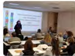
Montse Jiménez y 2 más 11:07 - 03 mar. 22 - Twitter Web App

Vedruna Catalunya Educació @VedrunaCat "Una societat creix i resplandeix quan les persones planten arbres a l'ombra dels quals tal vegada mai s'asseuran". Avui, trobada amb els grups de treball dels ODS de la xarxa d'escoles Vedruna per impulsar junts un itinerari compartit. #ODSVedruna