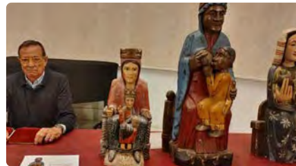
El Grup de Recerca repassa les marededeus perdudes de la Cerdanya DV, 04/02/2022 | REGIÓ 7