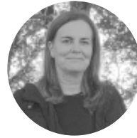
MONTSERRAT BOIXAREU A OBAUDIRE

Arribats al dimecres de cendra d'enguany, el Papa Francesc ha fet una crida, "a creients i no creients", a respondre a "la insensatesa diabòlica de la violència amb les armes de Déu, amb la pregària i el dejuni".