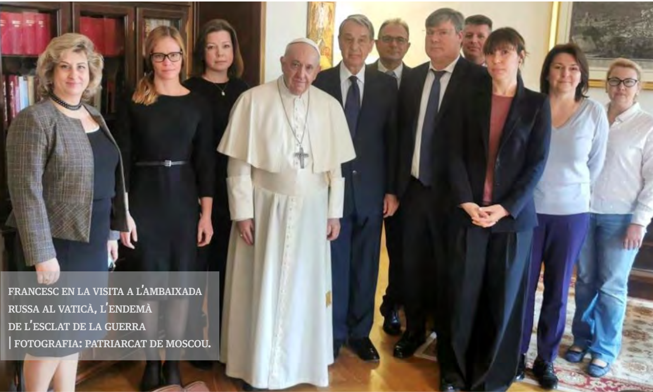
FRANCESC EN LA VISITA A L'AMBAIXADA RUSSA AL VATICÀ, L'ENDEMÀ DE L'ESCLAT DE LA GUERRA