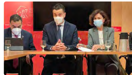
El Defensor del Poble mantindrà informat el Congrés sobre la investigació de la pederàstia a l'Església DM, 01/03/2022 | EL PAÍS