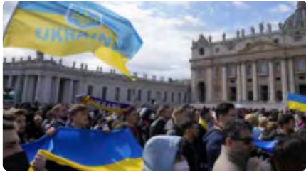
El Vaticà s'ofereix a mediar entre Rússia i Ucraïna DL, 28/02/2022 | LA VANGUARDIA