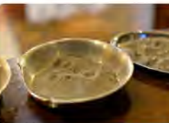
13:00 - 02 mar. 22 - Hootsuite Inc.

Jesuïtes Catalunya @jesuistescat Enfront de la desil·lusió pels somnis trencats, tenim la temptació de caure en l'egoisme individualista i la indiferència. La Qüaresma ens crida a posar la fe i l'esperança en el Senyor: "No ens cansem de fer el bé". Missatge de Qüaresma del Papa Francesc ow.ly/6CBT50I7MEn