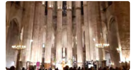
Santa Maria del Mar acull una pregària ecumènica per la pau a Ucraïna DV, 04/03/2022 | TV3