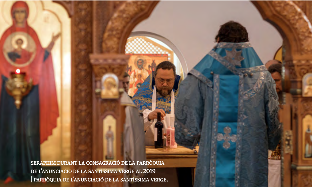
SERAPHIM DURANT LA CONSAGRACIÓ DE LA PARRÒQUIA DE L'ANUNCIACIÓ DE LA SANTÍSSIMA VERGE AL 2019