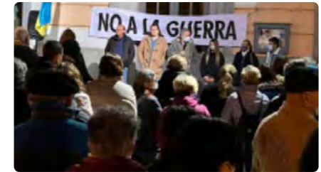
La comunitat ortodoxa d'Olot recull material per a Ucraïna a l'església dels Caputxins DC, 02/03/2022 | EL PUNT AVUI