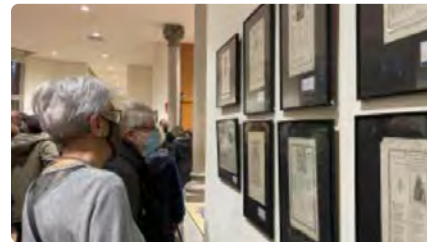
L'exposició de Manresa en honor a Sant Ignasi incorpora dos nous goigs DV, 04/02/2022 | REGIÓ 7