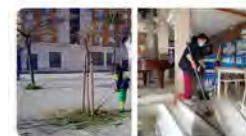
14:54 - 26 feb. 20 - Twitter Web App

Sant Joan de Déu Serveis Soc. @SJD_SS_Bcn 6 persones acompanyades als nostres centres tenen ara un contracte de feina d'1 any a jornada completa gràcies al programa ESAL d' @ocupaciocat . ESAL vetlla per la #InsercióLaboral de dones, persones trans i també per aquelles que estan en situació d'atur de llarga durada.