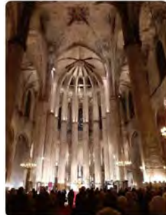
19:50 - 03 mar. 22 - Twitter for Android

Justícia i Pau @JusticiaIPau Presentes a la pregària ecumènica a Santa Maria del Mar. #Noalaguerra