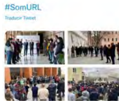
La Salle BCN i 9 més 13:32 - 02 mar. 22 - Twitter Web App

U. Ramon Llull (URL) @uramonlull Avui a les 12h, a diferents emplaçaments de la #URL , hem fet un minut de silenci contra la guerra a #Ucraïna i a favor de la #pau , seguint la crida a l'oració del @Pontifex es i de l' @esglesiaibcn .