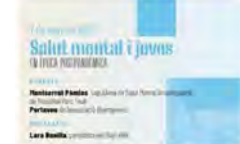
09:04 - 04 mar. 22 - Twitter for iPad