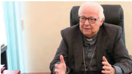
El bisbe de Girona ingressa a la Unitat de Cures Intensives DJ, 03/03/2022 | BISBAT DE GIRONA