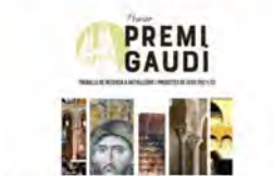
Facultat Antoni Gaudí y 2 más 6:21 - 14 feb. 22 - Twitter Web App

Dep. Pastoral FECC @FECC_Pastoral Premi Gaudí : Oberta la recepció de treballs de recerca (BTX+CFGS) sobre fet religiós: bit.ly/3Lu6m6P convocat per @FECC_Pastoral i l'unisantpacia amb suport de @castellnoued, Data límit 27 de maig. @afersreligiosos @JuntsR @educaciocat Traducir Tweet