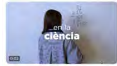
222 reproducciones 9:01 - 11 feb. 22 - Metricool

Escola Pia Catalunya @escolapiacat Eduquem i transformem la societat perquè totes tinguem les mateixes oportunitats. #11fdiadeladonailanensenlaciencia Traducir Tweet