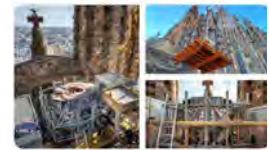
11:59 - 18 feb. 22 - Twitter Web App

La Sagrada Família @sagradafamilia Aquesta setmana hem pujat a la plataforma de treball, a 54 metres, l'armat i encofrat de l'icosaedre del terminal de la torre de Lluc per formigonar-lo. Un cop finalitzada la torre, d'aquest element en sorgirà el tetramorf en forma de bou alat amb el llibre. Traducir Tweet