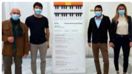
Igalada recupera el Festival d'Orgue amb cinc concerts a la Basílica de Santa Maria