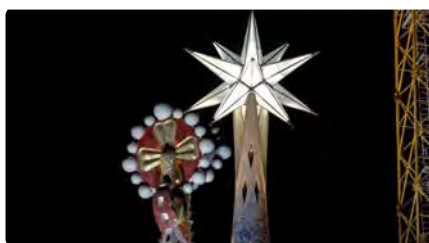
L'estrella de la Sagrada Família brillarà cada dia al capvespre