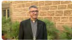
18:37 - 12 feb. 22 - Hootsuite Inc.

Abadia de Montserrat @montserratinfo Record del P. Manel Gasch, abat de #Montserrat al seu estimat amic, el bisbe Toni Vadell Ferrer catalunyareligio.cat/ca/abat-gasch-... Traducir Tweet