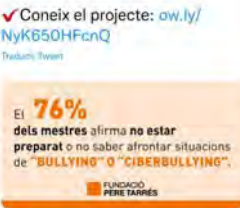
11:01 - 18 feb. 22 - Hootsuite Inc.

Fundació Pere Tarrés @Fundpenetarras L'assetjament a les escoles és un problema pel qual no tots els professors tenen eines necessàries per poder-lo erradicar. Desde la Fundació Pere Tarrés hem elaborat el projecte de "Mediadors de Pati". Traducir Tweet