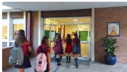
Les escoles de l'Opus lamenten haver de canviar el seu model segregador per tal de mantenir l'ajut públic