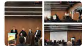
Obs Blanquerna y 6 más 11:09 - 17 feb. 22 - Twitter Web App

Càtedra de Libertat Religiosa @libreligiosa A #Madrid per assistir a la celebració de la Jornada Internacional de la Fraternitat Humana, un acte conjunt de la @Confepiscopal, la Comissió Islàmica i la Federació de Comunitats Jueves d'Espanya 🇪🇸 Traducir Tweet