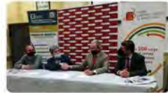
Gran instal·lació BCN y 2 más 20:27 - 16 feb. 22 - Twitter Web App

Vedruna Catalunya Educació @VedrunaCat Contents d'impulsar la formació professional i generar oportunitats per als #joves 🙌 Avui hem signat conveni amb @EGIBCN per tirar endavant un CFGM d'instal·lacions de producció de calor a @ImmaVedruna #FP #ciclesformatius #escolacompetent Traducir Tweet