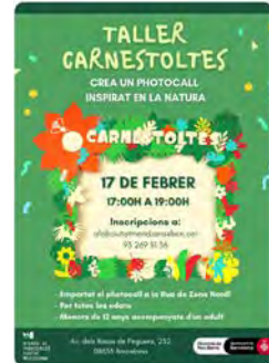
12:21 - 19 feb. 22 - Twitter for Android

PES Centre Crulla - Salesians @centrecrulla Taller de Carnestoltes. @BCN_AteneusFab @bcn_ajuntament Traducir Tweet