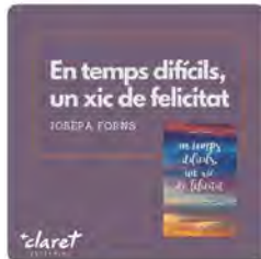
14:01 - 18 feb. 22 - Hootsuite Inc.