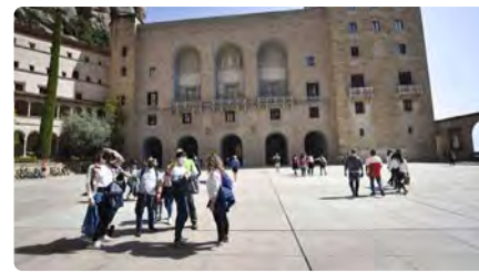
La Flama de la Llengua Catalana arriba aquest diumenge a Montserrat