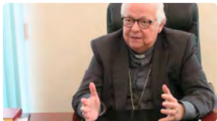
El bisbe de Girona, ingressat per problemes de salut