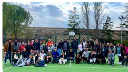
La Fundació del Convent de Santa Clara impulsa un projecte de formació i inserció laboral

DM, 15/02/2022 | ARQUEBISBAT DE TARRAGONA