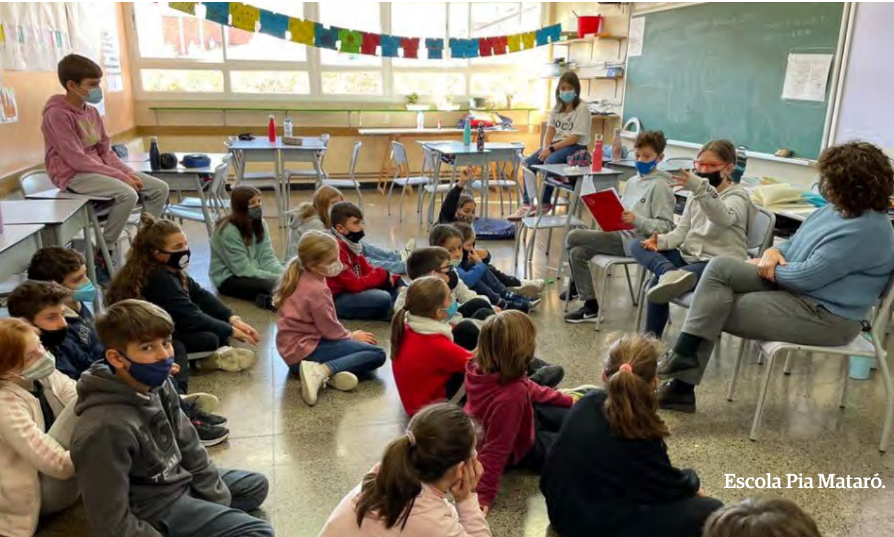
Escola Pia Mataró.