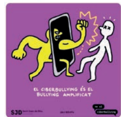
Sant Joan de Déu CAT y 9 más 15:10 · 27 ene. 22 · Twitter Web App

A NOalCiberbullying.org trobaràs eines digitals i consells bit.ly/3q050IH Traducir Tweet