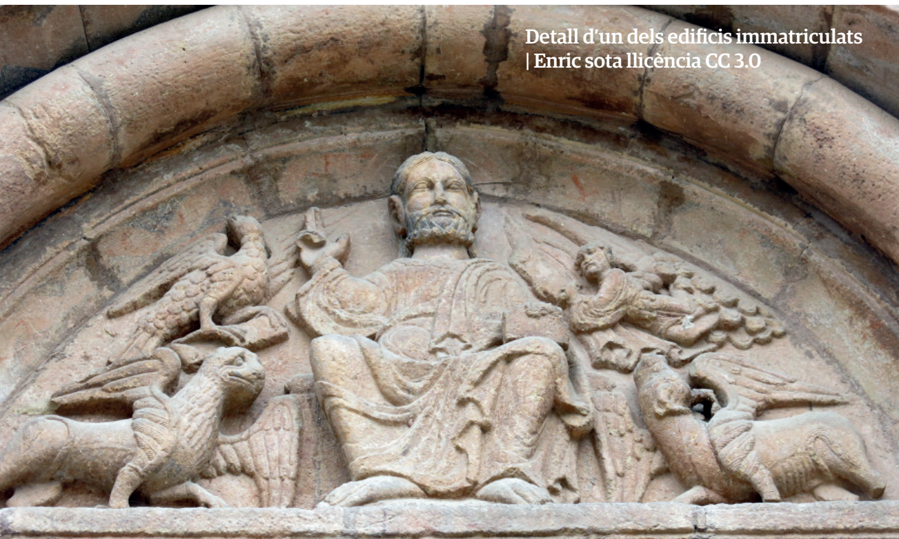
Detall d'un dels edificis immatriculats