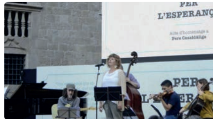
L'Ajuntament de Barcelona lliura la medalla de la ciutat a Casaldàliga a títol pòstum DM, 25/01/2022 | REGIÓ 7