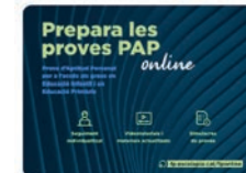
11:53 · 26 ene. 22 · Metricool

Per més informació i inscripcions: fp.escolapia.cat/fponline/prova... !!ÚLTIMS PLACES!! Traducir Tweet