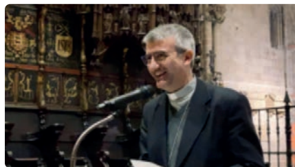
El bisbe Vadell continua hospitalitzat i pateix una evolució greu de la seva malaltia DJ, 27/01/2022 | ARQUEBISBAT DE BARCELONA