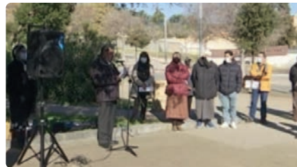
Les comunitats religioses de Mataró s'uneixen per la pau DM, 25/01/2022 | MATARÓ AUDIOVISUAL