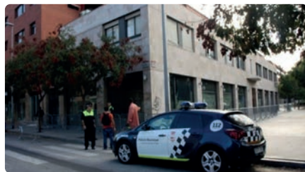
El conflicte per la segona mesquita de Mollet torna a enquistar-se vuit anys després DJ, 27/01/2022 | ARA