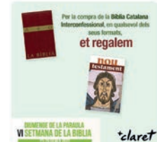
20:01 · 27 ene. 22 · Hootsuite Inc.

Libreria Claret @LibreriaClaret Aquesta setmana se celebra la 6a @SetmanaBiblia Pots consultar la programació a ow.ly/kgWo50HBnxy Fins el 29/01, per la compra de la Bíblia Calatana Interconfessional, et regalem el Nou testament. Pots trobar-la a bit.ly/32svs8p o a Roger de Llúria, 5 Bcn Traducir Tweet