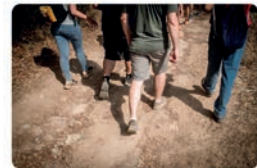
20:44 · 27 ene. 22 · Twitter Web App

Jesúites Catalunya @Jesuitescat Seguir les passes d'Ignasi de Loiola a Montserrat i Manresa, 500 anys després. Una experiència que podeu viure el proper mes de març. La convocatòria ja és oberta. jesuites.net/ca/noticia/seg... @Casal_Loiola @ComunitatClot @JesuitesEdu @magis_cat Traducir Tweet