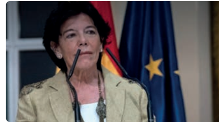
L'exministra Celaà, nova ambaixadora d'Espanya davant la Santa Seu DC, 26/01/2022 | EL NACIONAL