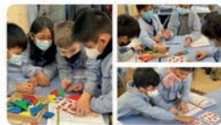
19:28 · 26 ene. 22 · Twitter for iPhone

La Salle Comtal @LaSalleComtal A través del joc aprenem coses noves de manera divertida! Els alumnes de 3r ens ho demostren amb activitats de l'àmbit matemàtic 🧐 #PriComtal #EstàsACasa Traducir Tweet