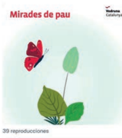
8:54 · 28 ene. 22 · Twitter for Android

Vedruna Catalunya Educació @VedrunaCat Celebrem el #DENIP! I ho fem amb mirades de pau #miradesVedruna #intensament #educació #pau #noviolència Traducir Tweet