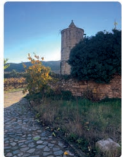
15:42 · 26 ene. 22 · Twitter for iPhone

Monestir de Poblet @MonestirPoblet Avui celebrem la Solemnitat dels Pares Fundadors, Sant Robert, Sant Esteve i Sant Alberic. L'any 1098 deixaren el Monestir de Molesmes, per fundar un nou Monestir del Cister. Un grup de 21 monjos desitjosos de viure la puresa de la Regla de Sant Benet, emprenen el nou camí. Traducir Tweet