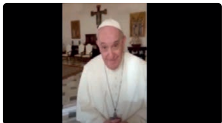
Francesc encoratja els habitants de l'illa de La Palma afectats pel volcà DLL, 24/01/2022