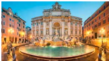
Les monedes de la Fontana di Trevi ja no aniran a Càritas Dg, 13/01/2019 | La Vanguardia