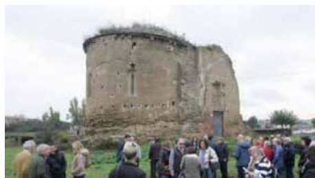
El Govern declara l'església de Sant Ruf com a Bé d'Interès Nacional Dc, 16/01/2019 | Segre