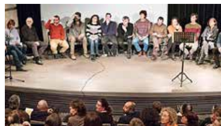
Conjura en marxa perquè Manresa 2022 sigui una oportunitat espiritual Dj, 17/01/2019 | Regió 7