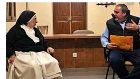
Alerta Digital reconeix que es va inventar la prostitució de sor Lucía Dm, 15/01/2019 | Regió 7