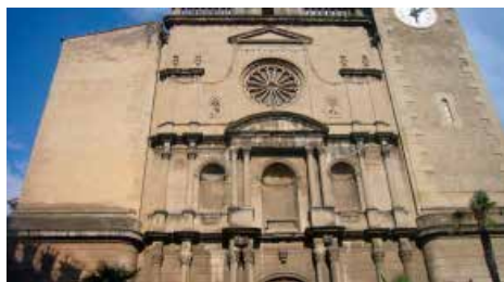
Cobreixen la façana de Sant Esteve d'Olot amb una malla protectora Dc, 16/01/2019