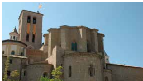
El nou arxiver diocesà de Solsona diu que cal una atenció especial per als pergamins Dg, 13/01/2019 | Regió 7