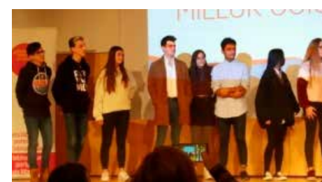
Tres alumnes de Vedruna d'Artés guanyen un concurs de vídeos breus sobre llibres Dv, 18/01/2019 | Regió 7