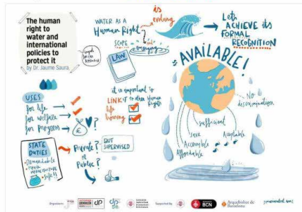
1:27 - 29 de set. de 2018

Ahir varem iniciar l'International Workshop of #JusticeAndPeace Europe. Compartim amb vosaltres la rotatoria visual de la sessió inaugural (artista: @mariacalveta)