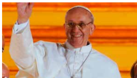
El papa rebrà el president de Xile el 13 d'octubre al Vaticà Dc, 03/10/2018 | La Vanguardia