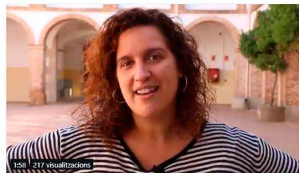
2:59 - 5 d'oct. de 2018

Ara sí! Aquest cap de setmana molts centres obriu les portes per començar un nou curs d'esplai ple de valors, d'activitats i de somnis! 😊 Sabeu quin desig tenen monis, docents i consell directiu per aquesta nova aventura? 🙌 Bon curs monis! 🙌 #SomMoviment #esplaisMCECC