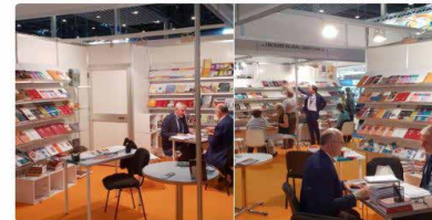
7:43 - 3 d'oct. de 2018

#Liber18 #Barcelona #NOVEDADES stand B223 book.cpl.es/default.asp