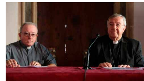
Taltavull dona més pes a dones i laics en la Diòcesi de Mallorca i sospesa reduir el nombre de misses Dc, 03/10/2018 | Última Hora