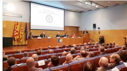
4:19 - 2 d'oct. de 2018

Josep M. Garrell #RectorURL: "El compromís cap a la ciència i la recerca és total a la #URL, i des dels nostres orígens. És una missió detallada als nostres documents fundacionals" #InauguracioURL