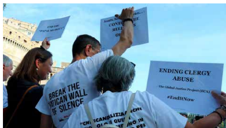
Víctimes d'abús: "No som enemics, ajudem a l'Església" Dj, 04/10/2018 | Vatican Insider