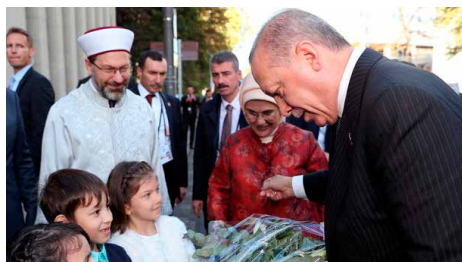
Erdogan inaugura la mesquita més gran d'Alemanya Dg, 30/09/2018 | Ara.cat