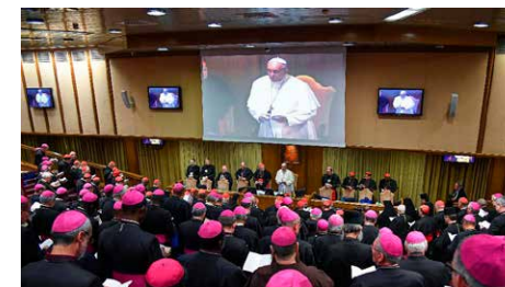
Sínode; Baldisseri: més de 100 mil respostes dels joves del món al qüestionari en línia Dv, 05/10/2018 | Vatican Insider