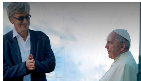
El documental de Wenders sobre el Papa arriba als cinemes Dc, 03/10/2018 | El Nacional