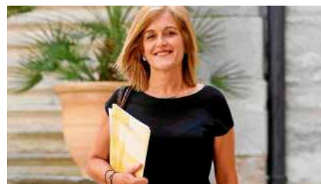
Crida a l'Església, ajuntaments, ens comarcals i cases de colònies a trobar espais per a menors Dj, 04/10/2018 | Diari de Girona