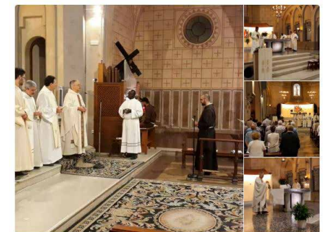
11:22 - 4 d'oct. de 2018

#AraMateix Celebrem l'Ofici Solemne en honor de Sant Francesc d'Assís, al convent d'Arenys. Un dels últims actes de l' #AnyCaputxi @radioarenys @AjArenys @bisbatgirona @catreligio by @barrinaire.