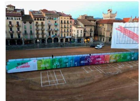
23:30 - 4 d'oct. de 2018

Es desperta serena la plaça de Vic. A punt per rebre 3000 nenes, nens i docents que vinguts d'arreu de Catalunya avui caminaran per tots aquells que no tenen tantes oportunitats. Des de @VedrunaCat fer esport, fer natura., fer país i conivire x fer un món més solidari