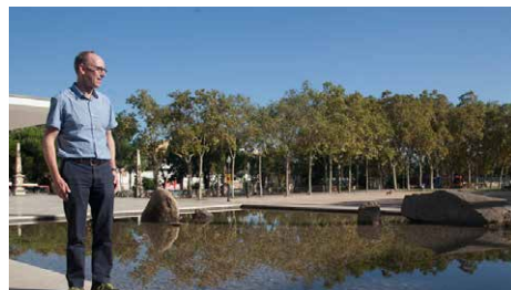
Un jardí zen al pavelló Mies Dl, 01/10/2018 | El Punt Avui