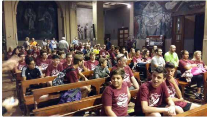
8:45 - 5 d'oct. de 2018

Tret de sortida a la XVII pujada Rocafort Montserrat #rocsalesians1819