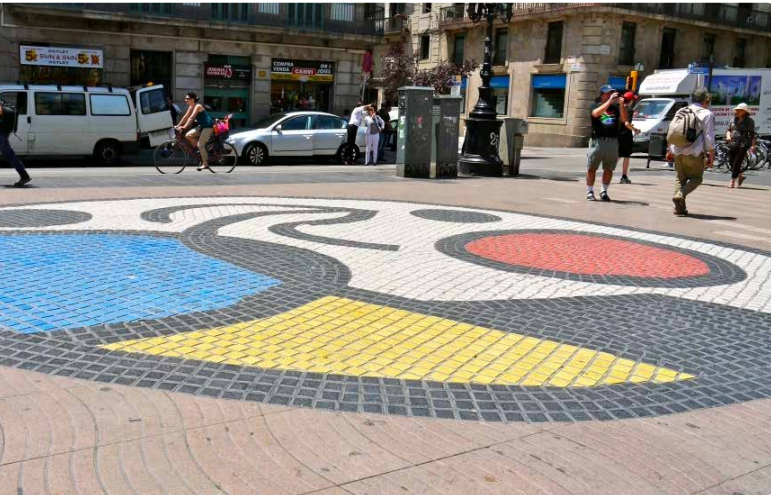
Fotografia: Jean Robert Thibault sota llicència CC 2.0.