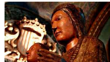
Olot mostrarà els somriures de la verge del Tura en una exposició Dv, 31/08/2018 | Diari de Girona