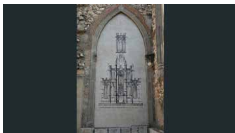
L'església de Sant Joan de Reus es podrà visitar virtualment Dc, 29/08/2018 | Diari de Tarragona