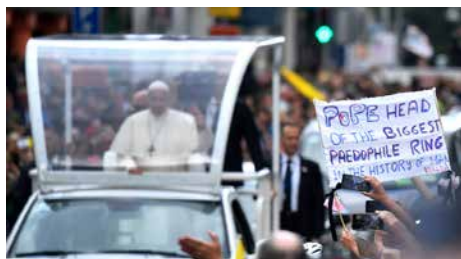
El papa Francesc es reuneix amb víctimes d'abusos del clergat a Irlanda Dil, 27/08/2018 | 324.cat