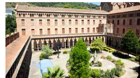
El monestir cistercenc de Valldonzella cedeix espai per tractar menors amb problemes Dm, 28/08/2018 | La Vanguardia