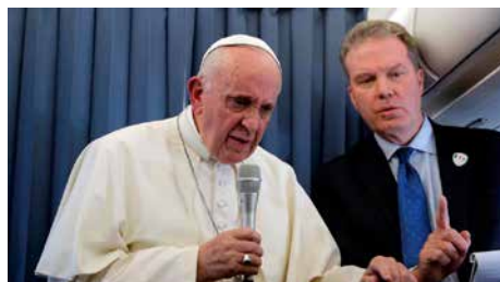
L'acusació de l'exnunci Viganò confirma la dura oposició al Papa Dm, 28/08/2018 | La Vanguardia