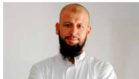
L'imam de Cambrils: "Un registre oficial d'imams ajudaria a evitar nous casos" Dm, 28/08/2018 | Diari de Girona