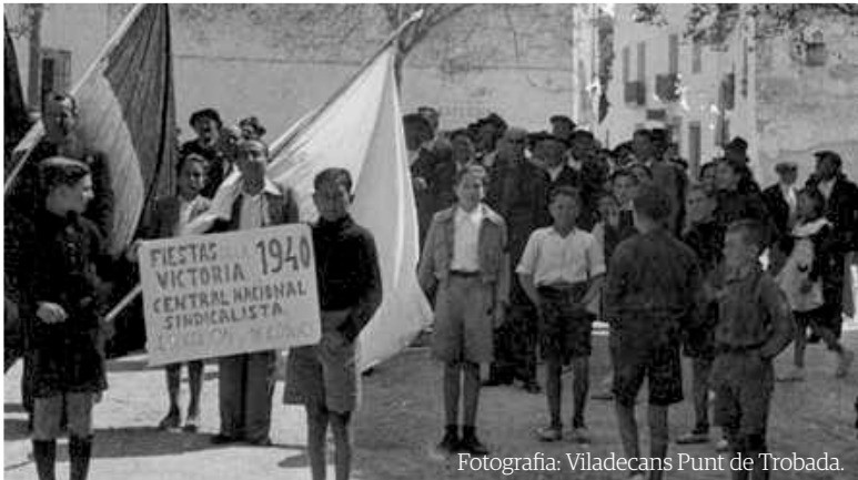
Fotografia: Viladecans Punt de Trobada.