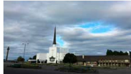
La Irlanda que espera al Papa entre mesures de seguretat insòlites i entrades esgotades Dm, 10/07/2018 | Vatican Insider