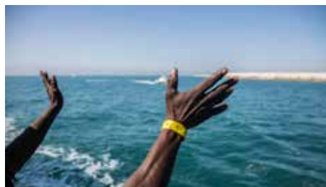
Missa al Vaticà pels refugiats Dv, 06/07/2018 | Vatican Insider