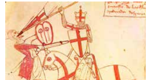
L'assaig general de les Croades va tenir lloc a Barbastre Dc, 11/07/2018 | El País