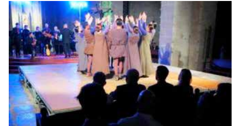
La Fira Mediterrània exporta el 'Llibre Vermell de Montserrat' a Alemanya Dl, 09/07/2018 | Regió 7