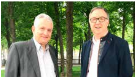
"El bisbe Carrera va deixar una empremta lluminosa", per Jordi Breu i Jaume Aymar Dg, 08/07/2018 | El Punt Avui