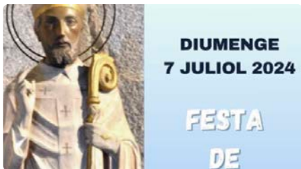
La Seu d'Urgell celebra la festivitat de Sant Ot, patró de la ciutat DG, 07/07/2024 | RÀDIO SEU