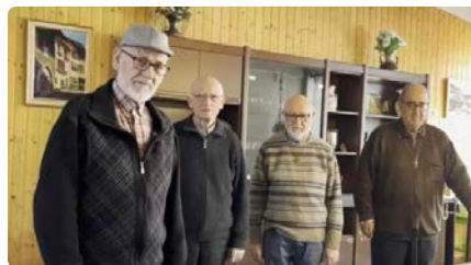
La comunitat de La Salle deixa de tenir presència a Manresa després de 114 anys DT, 09/07/2024 | REGIÓ 7