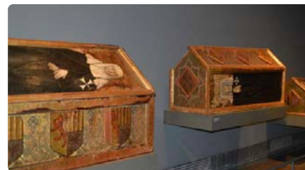
Justícia d'Aragó obre un expedient per la situació de les obres del Monestir de Sixena Dt, 09/07/2024 | VILA WEB