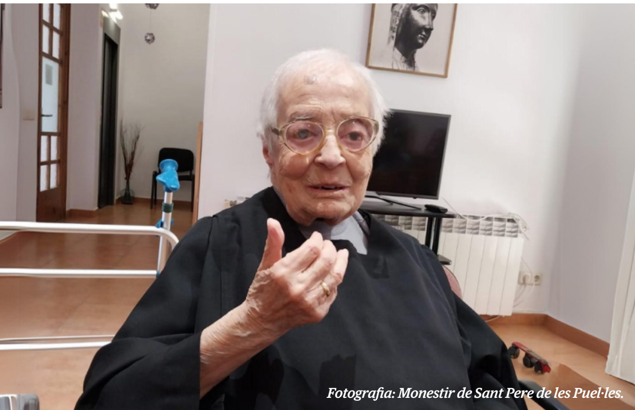
Fotografia: Monestir de Sant Pere de les Puel·les.