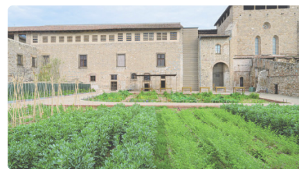
L'hort medieval del monestir de Pedralbes DV, 12/07/2024 | EL PUNT AVUI