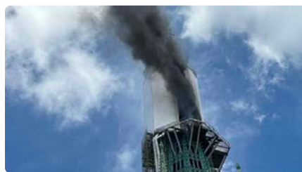
Crema l'agulla de la catedral de Rouen, una de les més emblemàtiques de França DJ, 11/07/2024 | 3/24