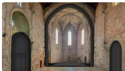
Montblanc rep una subvenció de 3 milions d'euros per rehabilitar l'antiga església de Sant Francesc DJ, 11/07/2024 | INFO CAMP