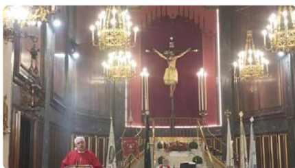
La Festa de la Puríssima Sang aplega més de 150 fidels DC, 10/07/2024 | REUS DIGITAL