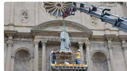
Olot recupera la imatge de Sant Esteve a l'església després que es destruís el 1936 durant la Guerra Civil DJ, 04/07/2024 | DIARI DE GIRONA