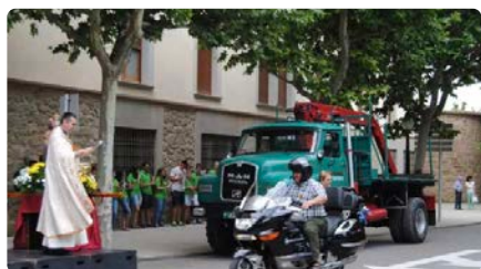
Solsona acull la 94a edició de la tradicional festa de Sant Cristòfol DJ, 04/07/2024 | REGIÓ 7