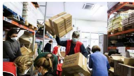
Càritas denuncia que les entitats socials estan patint retards en el pagament de les subvencions DC, 03/07/2024 | DIARI ARA