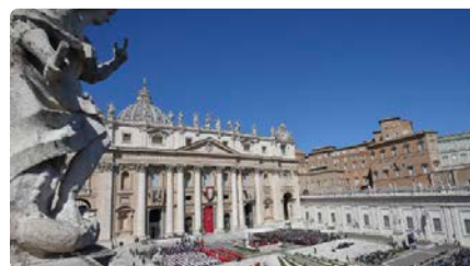
Vols treballar al Vaticà? Aquests són els requisits que has de complir DV, 05/07/2024 | EL NACIONAL