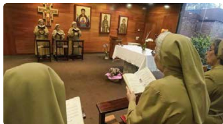
Mig segle de les monges clarisses a Vilobí d'Onyar DG, 30/06/2024 | DIARI DE GIRONA