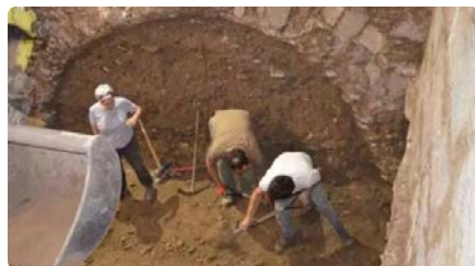
Excavacions arqueològiques descobreixen un carrer medieval a l'antic convent de Sant Domènec de Castelló d'Empúries DT, 02/07/2024 | DIARI DE GIRONA