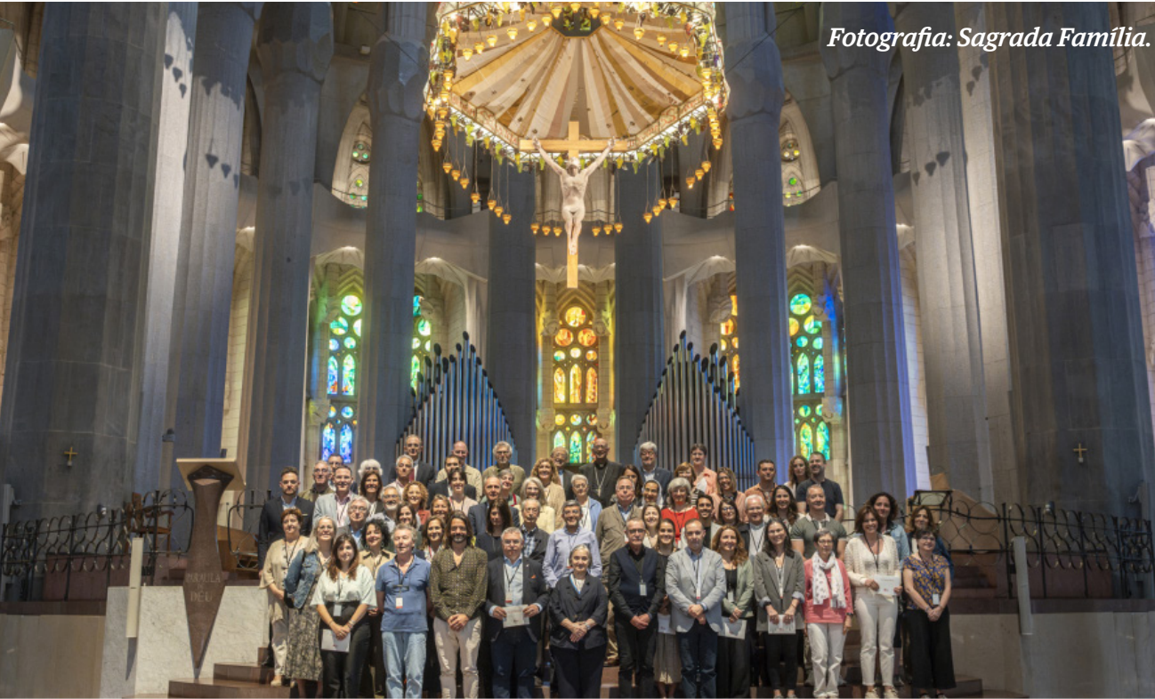
Fotografia: Sagrada Família.

“A la Sagrada Família ara li toca retornar als més vulnerables tota la solidaritat rebuda”