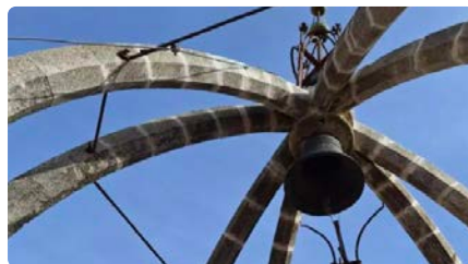
Moià consolida les parts més febles de l'església a l'espera d'una actuació global DC, 22/05/2024 | REGIÓ 7