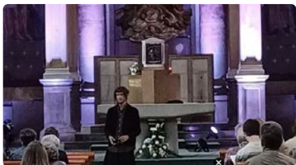
Minimalisme medieval en el segon concert del Festival Internacional d'Orgue de Capellades DL, 20/05/2024 | REGIÓ 7