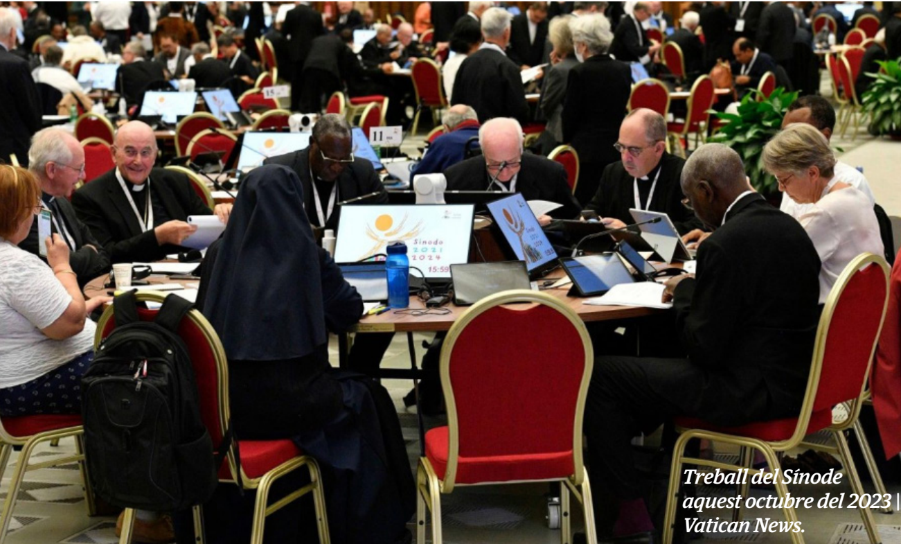
Treball del Sínode aquest octubre del 2023 | Vatican News.