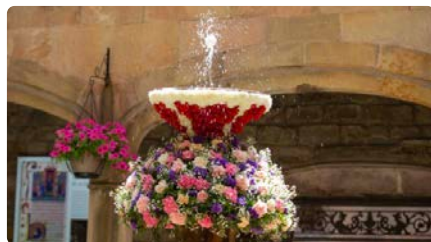
Corpus 2024 a Barcelona: on veure l'ou com balla, les catifes florals, els gegants i la processó DT, 21/05/2024 | EL NACIONAL