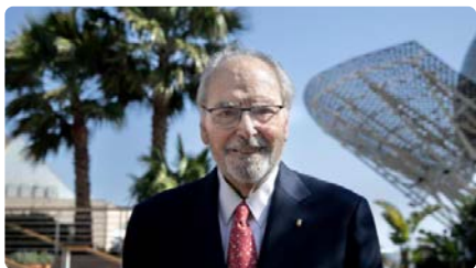
"El Dalai-lama va tocar el dos de l'hotel Arts sense pagar " DC, 22/05/2024 | LA VANGUARDIA