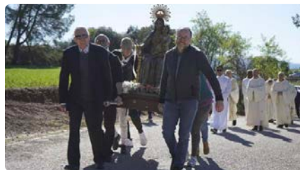
La verge de Joncadella farà dissabte una processó fins a la presó de Lledoners DV, 24/05/2024 | REGIÓ 7