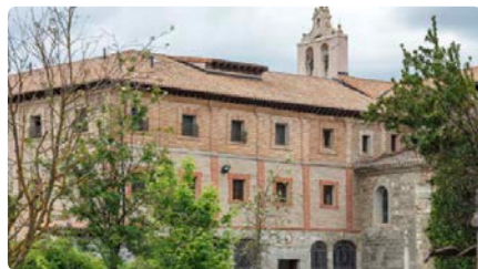
La Confederació de Clarisses es desmarca de les monges rebels de Belorado DJ, 23/05/2024 | LA VANGUARDIA