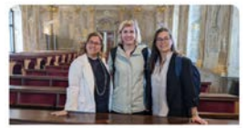
fje.edu Representants de Jesuites Educació participen en the International Conference on ...

Representants de #JesuitesEducació participen en the International Conference on Innovation in Education a Brno. És una oportunitat per donar veu al nostre projecte educatiu i també, intercanviar metodologies i coneixements.