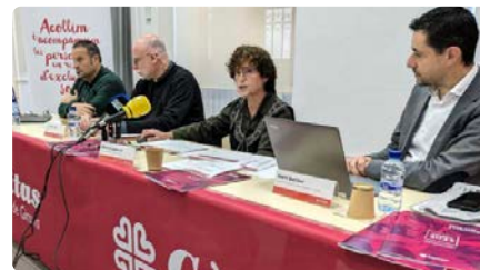
Les persones que treballen necessiten cada cop més l'ajuda de Càritas DV, 24/05/2024 | EL PUNT AVUI