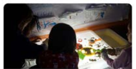
peretarrés.org Creix la vulnerabilitat de les famílies de Tarragona becades

La situació socioeconòmica de les persones que sol·liciten cada any #beques a la @Fundperetarrés perquè els #infants puguin gaudir d'activitats de #lleure a l'#estiu es manté en situació molt crítica, especialment a les comarques de #Tarragona.