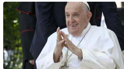
"No" rotund del Papa a ordenar diaconesses DC, 22/05/2024 | LA RAZÓN