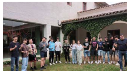
El Jesuïtes Col·legi Claver de Lleida participa als tallers d'arquitectura en espais educatius DC, 15/05/2024 | SEGRE