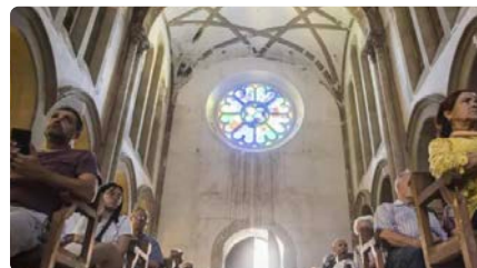
L'església de la Bauma de Castellbell recupera les misses regulars després de 30 anys DV, 17/05/2024 | REGIÓ 7