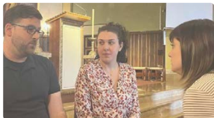
El matrimoni jove que s'encarrega de la parròquia de Cubelles: "L'Església s'ha d'obrir més cap a les dones" DJ, 16/05/2024 | RAC 1