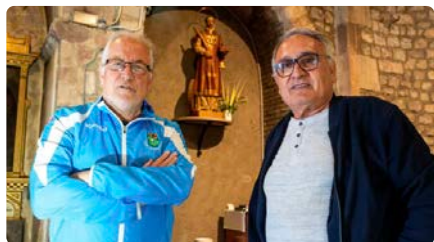
Campanya per tornar el nom de Sant Feliu al temple de Canovelles DL, 13/05/2024 | EL 9 NOU