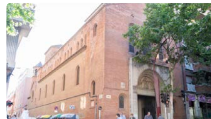
La Parròquia de la Santíssima Trinitat de Sabadell celebra 90 anys amb esperit fort DC, 15/05/2024 | DIARI DE SABADELL