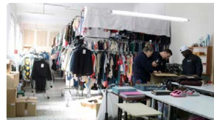
Una de cada quatre persones ateses per Càritas té feina DV, 17/05/2024 | EL PUNT AVUI