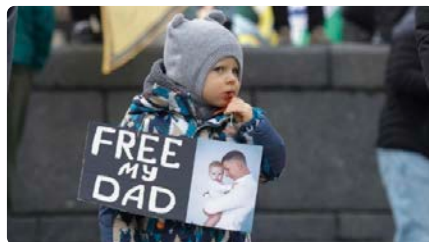
La Santa Seu, disposada a afavorir intercanvis de presoners entre Ucraïna i Rússia DL, 13/05/2024 | VATICAN NEWS