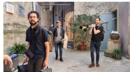
Manresa acull el rodatge d'un documental internacional sobre la vida de sant Ignasi DJ, 25/04/2024 | REGIÓ 7