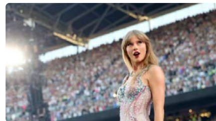
Una església triomfa anunciant que oficiarà misses amb cançons de Taylor Swift DC, 24/04/2024 | LA VANGUARDIA