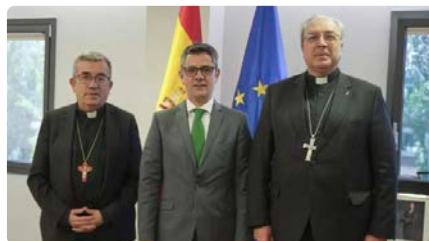
El Govern espanyol es tanca a compartir amb l'Església el pagament d'indemnitzacions a les víctimes de pederàstia DJ, 25/04/2024 | EL PERIÓDICO