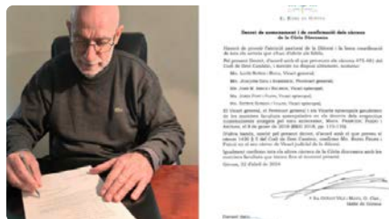
Primers nomenaments del bisbe Octavi Vilà a Girona DL, 22/04/2024 | BISBAT DE GIRONA