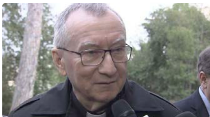
Cardenal Parolin: “Cal evitar tot el que pugui provocar una escalada bèl·lica a l'Orient Mitjà” DL, 22/04/2024 | VATICAN NEWS