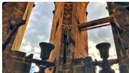
La XXXVII Trobada de Campaners fa valdre un ofici encara molt arrelat DJ, 25/04/2024 | TORNAVEU