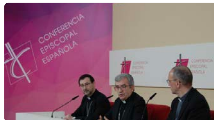
Els bisbes eleven a 1.057 la xifra d'abusadors al seu informe de pederàstia a l'Església