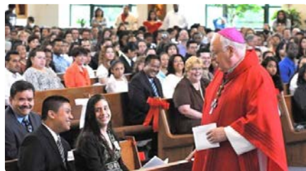
Mor el primer membre dels Fills de la Sagrada Família que va arribar a bisbe