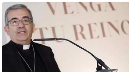
Gir conservador a l'Església espanyola: Argüello, arquebisbe de Valladolid, substitueix Omella