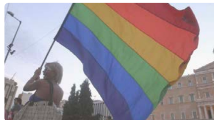
L'Església ortodoxa grega vol excomunicar els diputats que han legalitzat el matrimoni homosexual