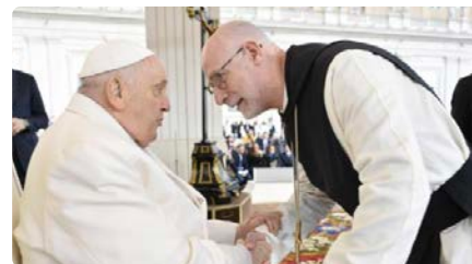
El papa Francesc a Octavi Vilà: "Girona està contenta amb el nou bisbe"