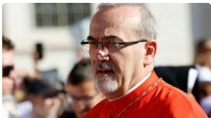
Cardenal Pizzaballa: "Que pari el foc a Gaza immediatament!"