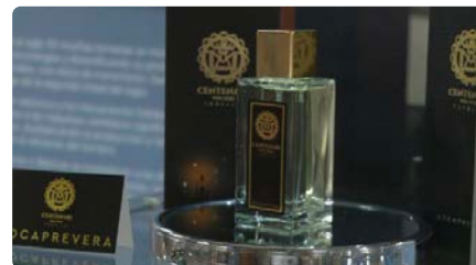
El Santuari de Rocaprevera estrena perfum propi amb motiu del seu centenari