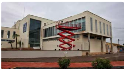
De casa okupa a església evangèlica romanesa: El projecte que transformarà una gran nau abandonada a Castelló DT, 20/02/2024 | EL PERIÓDICO