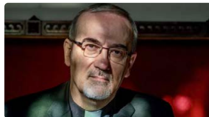
Cardenal Pizzaballa: "Posar el focus a Gaza dissimula l'avanç jueu a Cisjordània" DJ, 22/02/2024 | LA VANGUARDIA