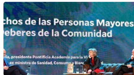
La Santa Seu promou a Espanya una llei integral per a la gent gran DJ, 22/02/2024 | LA VANGUARDIA