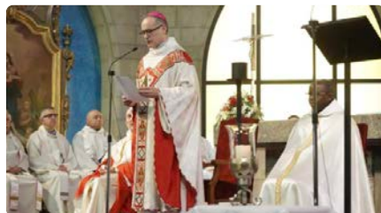
L'abat de Montserrat afirma que la Llum ha ajudat a construir la identitat manresana DJ, 22/02/2024 | REGIÓ 7