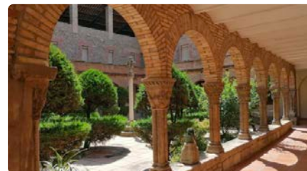
Pregària a Manresa per la pau a Ucraïna en els dos anys de l'inici del conflicte DV, 23/02/2024 | NACIÓ DIGITAL