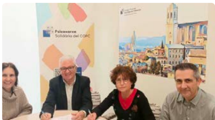
Conveni entre Càritas Girona i la Psicoxarxa solidària per atendre persones vulnerables DJ, 22/02/2024 | EL PUNT AVUI