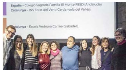
L'Escola Pia Santa Anna de Mataró, premiada pel seu "rendiment lector" DC, 21/02/2024 | CAPGRÒS