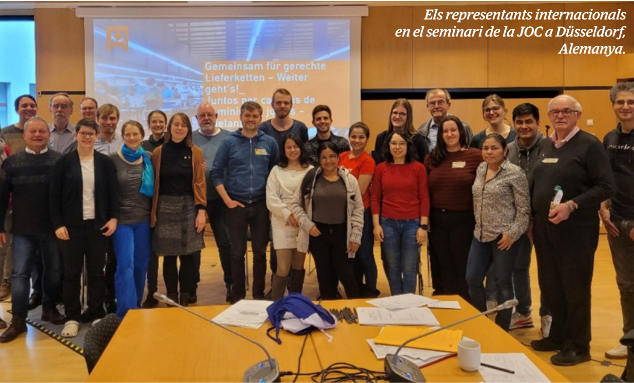
Els representants internacionals en el seminari de la JOC a Düsseldorf, Alemanya.

“La dignitat de ser fill de Déu no pot ser trepitjada per cap poder econòmic”