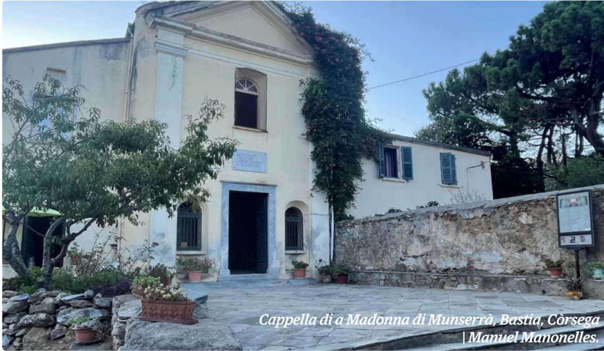
Cappella di a Madonna di Munserrà, Bastia, Còrsega | Manuel Manonelles.

però també una desfilada històrica al centre del municipi, tot acabant a la nit amb un espectacle pirotècnic.