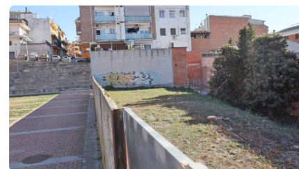
Un canvi urbanístic aplanarà el camí per construir una nova església a Bellavista DV, 19/01/2024 | EL 9 NOU