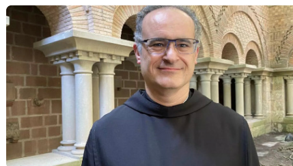
Els pares de l'abat de Montserrat DJ, 18/01/2024 | ARA