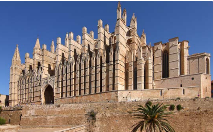
Fotografia: Catedral de Palma de Mallorca | Malopez sota llicència C.C.4.0