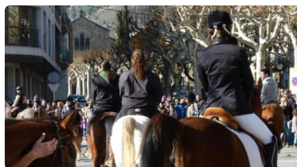
Solsona es prepara per reivindicar el seu llegat rural per Sant Antoni Abat DJ, 18/01/2024 | REGIÓ 7