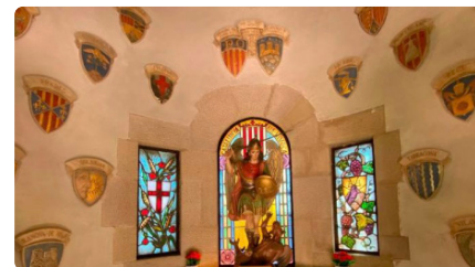
Recuperen els escuts desapareguts de l'oratori de Sant Miquel a l'Espluga de Francolí DT, 16/01/2024 | DIARI DE TARRAGONA