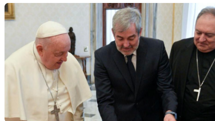
Els bisbes i el president de les Canàries traslladen al Papa la seva preocupació per "l'alarmant increment" de la crisi migratòria DT, 16/01/2024 | LA VANGUARDIA