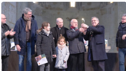
El Concurs de Pessebres lliura els premis omplint la Seu Vella DL, 15/01/2024 | LA MAÑANA