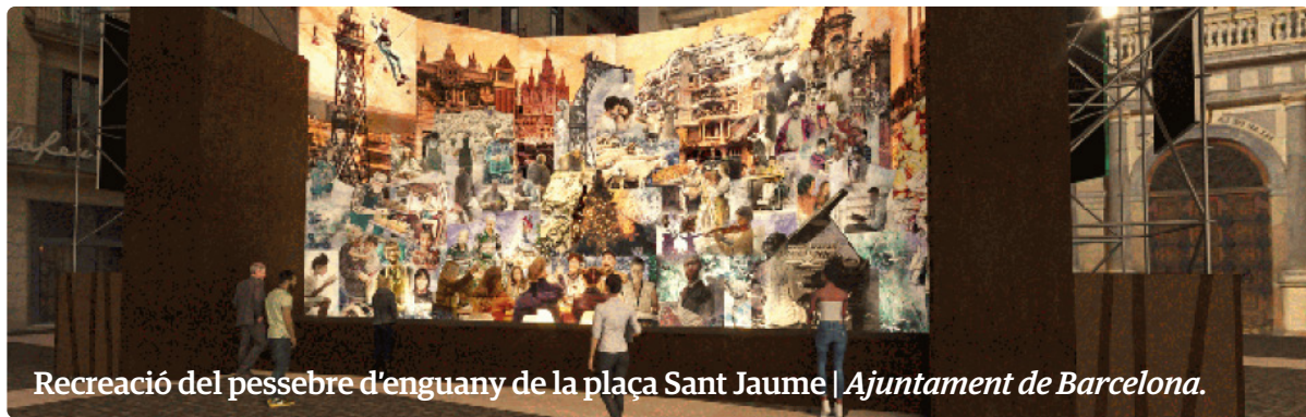
Recreació del pessebre d'enguany de la plaça Sant Jaume