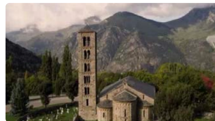
Les pintures exteriors de Sant Climent i Santa Maria de Taüll, revelades amb un màping DT, 28/11/2023 | 3/24