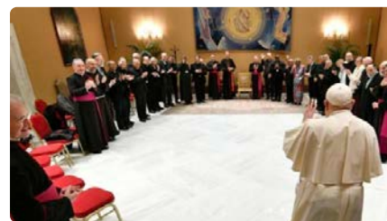
El Papa: "L'Església és dona, cal desmasculinitzar-la" DV, 01/12/2023