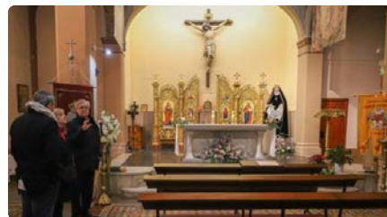
Junts insta a buscar ajuts per "salvar" l'església de la Sang de Lleida pel seu mal estat DT, 28/11/2023 | EL SEGRE