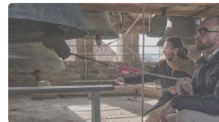
Les campanes de la Catedral de Vic repicaran per "cridar a la pluja" i acabar amb la sequera DC, 29/11/2023 | NACIÓ DIGITAL