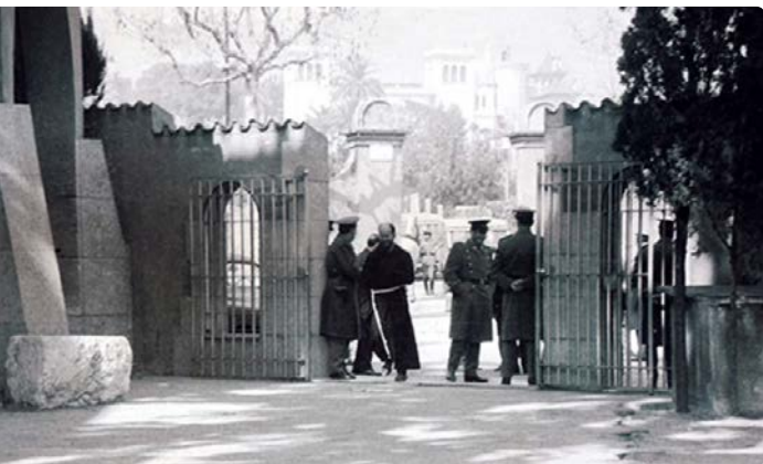
Foto: Barcelona, 10 de març de 1966. Guillem Martínez (Caputxinada)