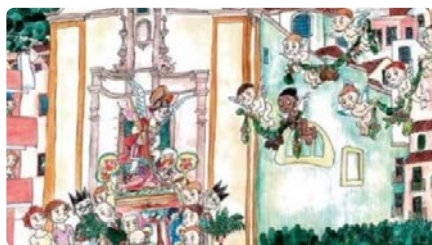
La Parròquia de Tivenys inicia la commemoració dels 250 anys de la construcció de l'Església de Sant Miquel i Sant Benet DJ, 30/11/2023 | EBRE DIGITAL