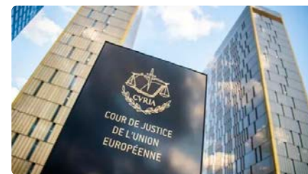
El TJUE avala que les administracions prohibeixin als treballadors portar signes religiosos DV, 01/12/2023 | 3/24