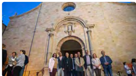
Juneda presenta la restauració de la façana de l'església de la Transfiguració del Senyor DG, 29/10/2023 | LA MAÑANA