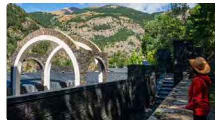
El santuari de Meritxell, la fita andorrana de la ruta mariana i de l'arquitectura de Bofill DC, 01/11/2023 | LA VANGUARDIA