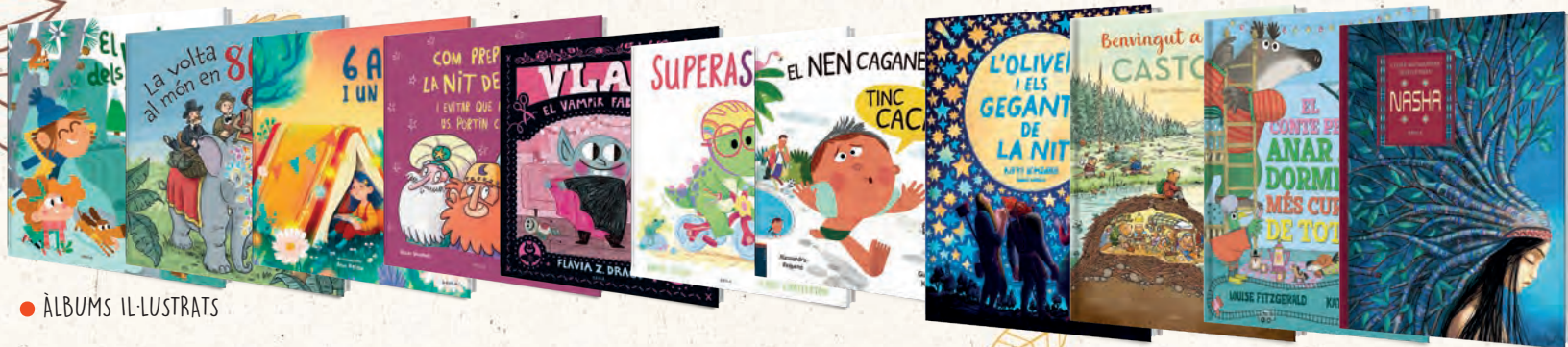
● ÀLBUMS IL·LUSTRATS