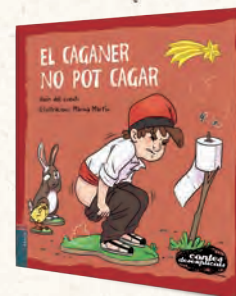
● CONTES DESEXPLICATS