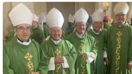
El bisbe de Solsona indica que el sinode convida a "avançar junts" DT, 31/10/2023 | REGIÓ 7