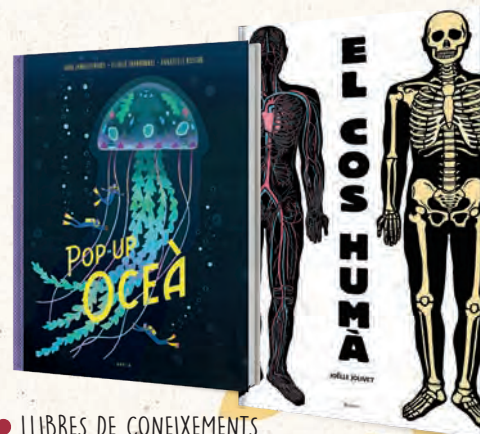
● LLIBRES DE CONEIXEMENTS