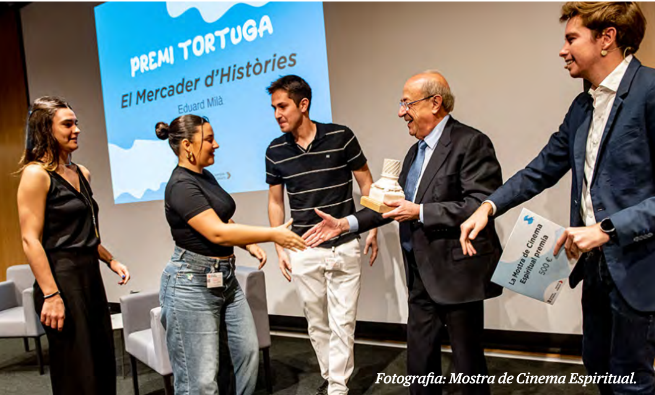
Fotografia: Mostra de Cinema Espiritual.