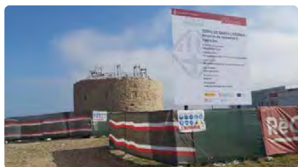
Les bastides d'obres substitueixen les antenes a la torre Santa Caterina de Manresa DJ, 02/11/2023 | REGIÓ 7