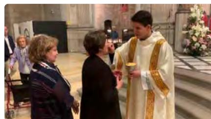
El bisbe de Lleida ordenarà el primer sacerdot des del 2016 DV, 03/11/2023 | LA MAÑANA