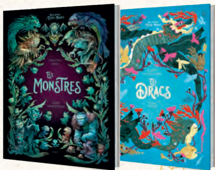
● ENCICLOPÈDIA D'ÈSSERS MÀGICS