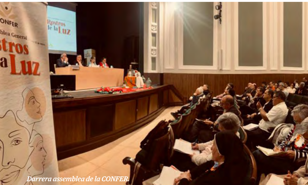
Darrera assemblea de la CONFER.