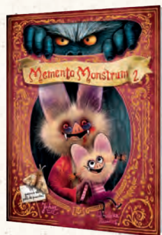
● LLIBRE REGAL