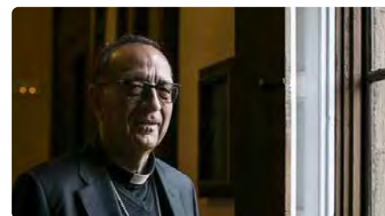
El Papa crida tots els bisbes espanyols a una reunió extraordinària a Roma DV, 03/11/2023 | DIARI ARA