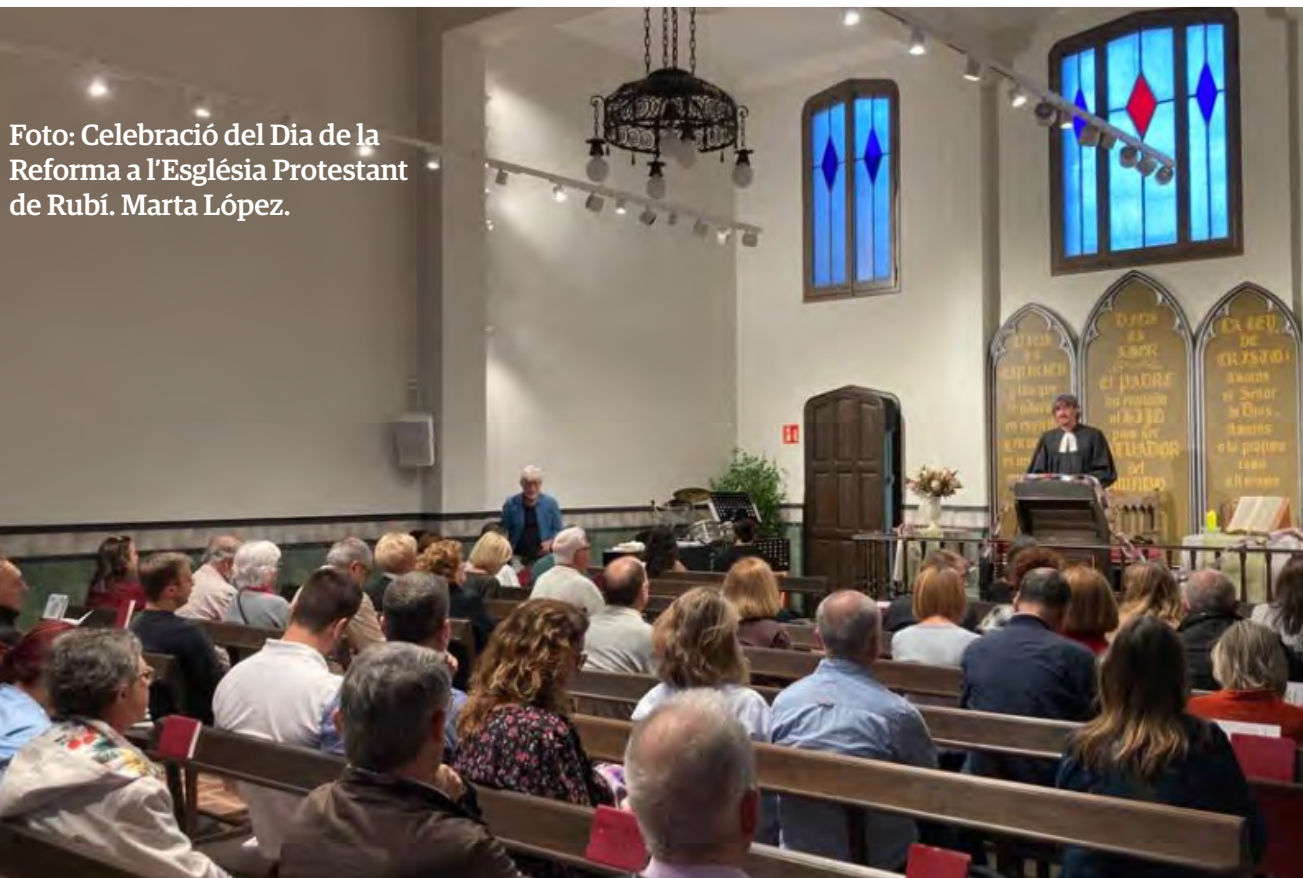
Foto: Celebració del Dia de la Reforma a l'Església Protestant de Rubí. Marta López.