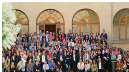
Més de cent cinquanta persones participen en la jornada de formació de Càritas de Catalunya a Vic DV, 03/12/2023 | REGIÓ 7