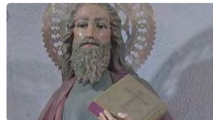
Sant Simó a punt pel gruix d'actes de la seva festa el cap de setmana DJ, 26/10/2023 | TVMATARÓ