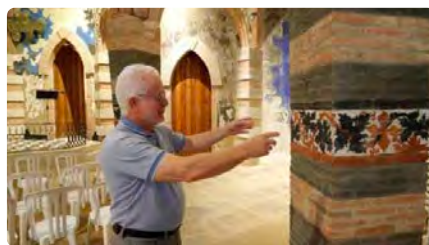
L'Església Sagrat Cor de Vistabella celebra el seu centenari i restauració amb tres concerts DJ, 26/10/2023 | DIARI DE TARRAGONA