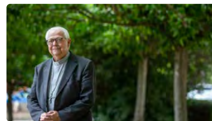
El bisbat de Girona insisteix que necessita un nou bisbe DV, 27/10/2023 | EL PUNT AVUI