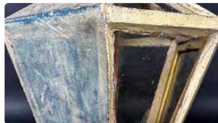
La ciutadania escull restaurar la custòdia de l'església Santa Eulàlia d'Encamp DC, 25/10/2023 | LA CIUTAT