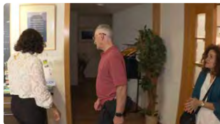
La Fe Baha-í, la religió més jove i perseguida del món, distingida a Espanya i premiada a Catalunya DL, 23/10/2023 | CCMA