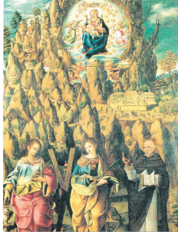
El quadre provinent de Santa Eulàlia dels Catalans. Obra de Giacomo Sirena i de l'any 1582.

També cal subratllar l'existència d'una parròquia de Santa Maria di Montserrat, de profundes arrels històriques i que tenia el seu temple a Piazza Castello, al barri de San Pietro, construcció barroca destruïda en els bombardejos de 1943. Així després de la segona Guerra Mundial, i a manca d'església, la parròquia es va traslladar a l'antiga capella de l'Istituto delle Croci, on encara es troba avui. En canvi, la imatge que presidia l'esmentat temple derruït sobrevisqué i es conserva actualment també a l'esmentat Museo Diocesano di Palermo.