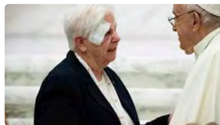
El sinode rebutja el sacerdoci femení i aposta per "visibilitzar" el paper de la dona a l'Església DV, 27/10/2023 | ABC