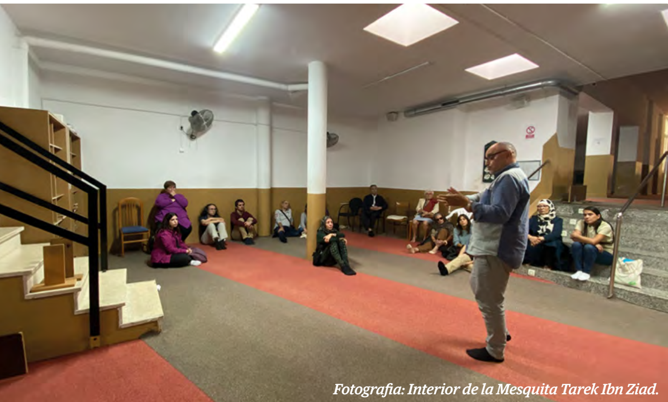
Fotografia: Interior de la Mesquita Tarek Ibn Ziad.