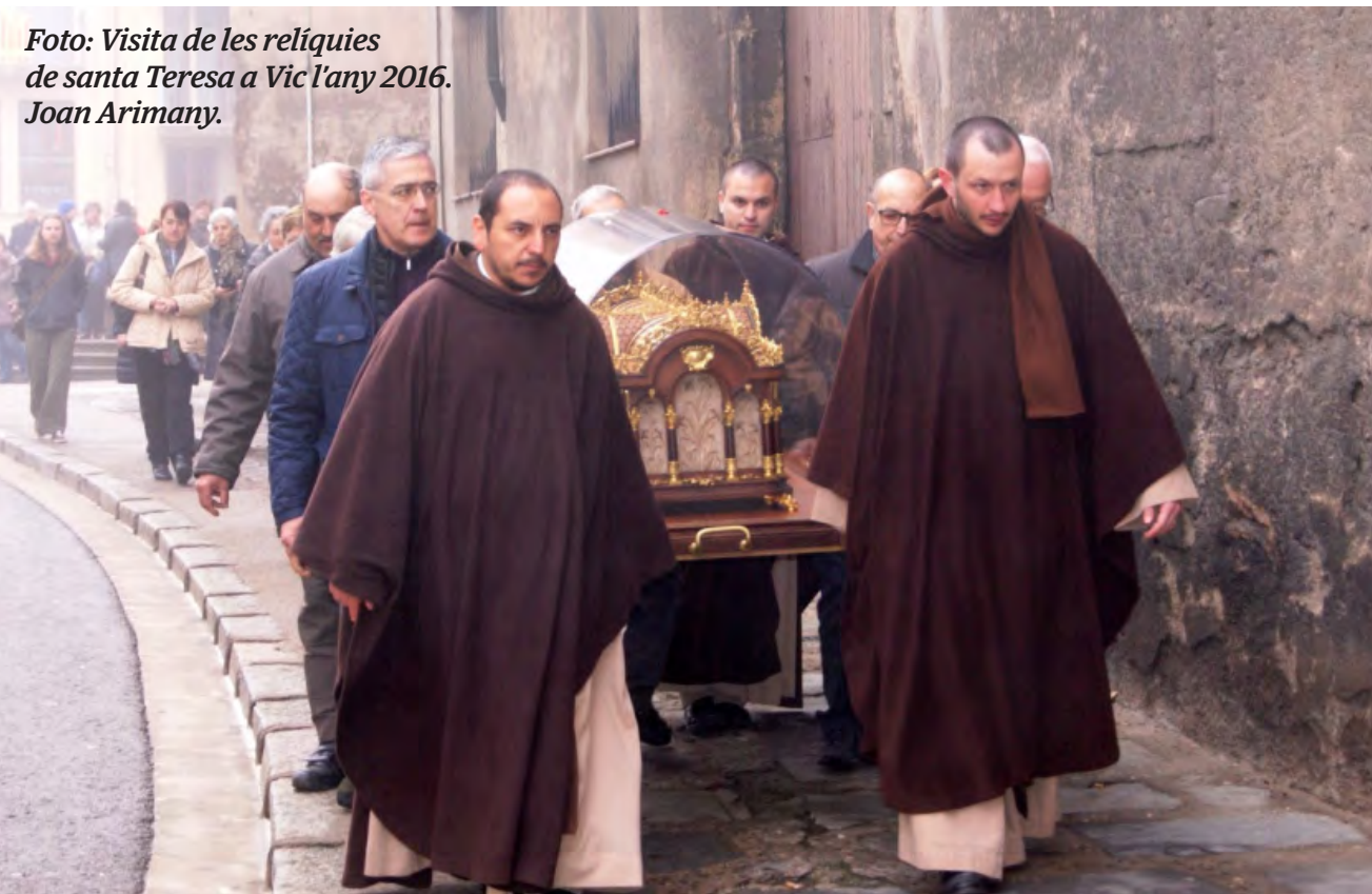
Foto: Visita de les relíquies de santa Teresa a Vic l'any 2016. Joan Arimany.