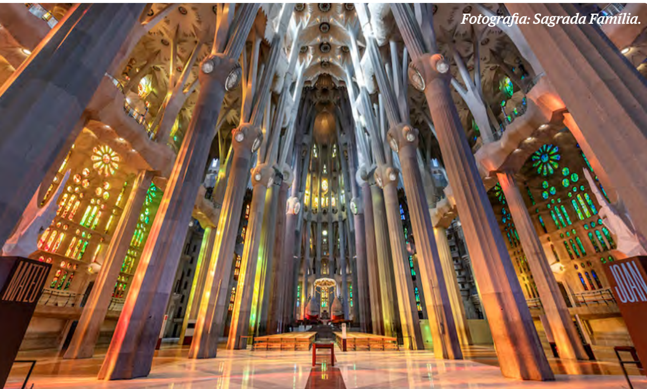
Fotografia: Sagrada Família.