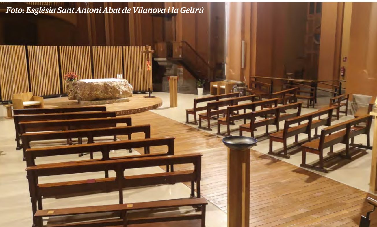
Foto: Església Sant Antoni Abat de Vilanova i la Geltrú