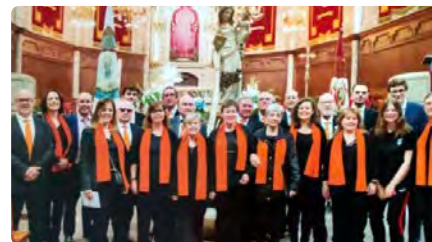
Cardona clou els 600 anys de la commemoració de la seva patrona amb un pelegrinatge a Roma DJ, 12/10/2023 | NACIÓ