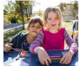
10:02 · 11 d'oct. 23 · 132 Visualitzacions

El nostre #compromís social es ratifica en dies com avui, #DiaInternacionaldeNena. Eduquem perquè les nenes, i també els nens, puguin gaudir com a infants i créixer com a persones en una societat igualitària, sense patir distincions per raons de #gènere ni edat.