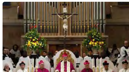
El patriarca de Jerusalem: «Al carrer es veu por i odi profund entre israelians i palestins» DJ, 12/10/2023 | EL PERIÒDICO