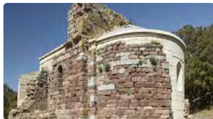
L'església de Sant Cristòfol dels Horts a Albanyà reneix de la ruïna i l'abandó DT, 10/10/2023 | DIARI DE GIRONA