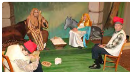
La Parròquia de Solsona organitza un Pessebre Vivent DV, 13/10/2023