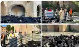
12:23 · 09 d'oct. 23 · 3.014 Visualitzacions

Un ramat de cabres acompanyades del seu pastor arribava ahir al vespre al @MonestirPoblet per fer-hi nit. Aquest matí s'ha fet la benedicció del ramat a la plaça i després han continuat la ruta, recuperant un antic camí ramader que arriba fins a Prades.