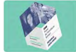
Col·legi de Periodistes de Catalunya i 7 més 12:34 · 11 d'oct. 23