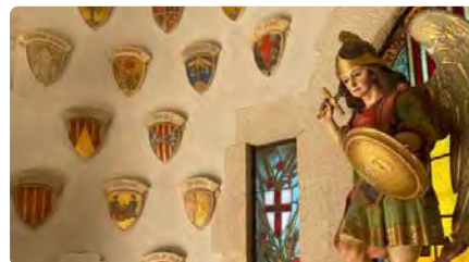
Roben dues peces patrimonials de la parròquia de Sant Miquel Arcàngel a l'Espluga de Francolí DV, 13/10/2023 | TARRAGONA DIGITAL