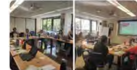
20:13 · 11 d'oct. 23 · 181 Visualitzacions

Avui hi ha hagut assemblea dels responsables de comunicació de les #obresocialsmaistes. Noves idees, projectes, col·laboracions i aliances sempre al servei d'infants i joves. Entre tots, fem camí! #Etsacasà #Maristesetsacasà