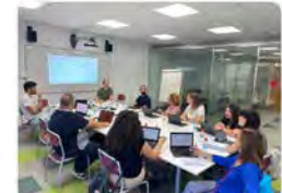
09:43 · 10 d'oct. 23 · 782 Visualitzacions

Avui, primera trobada de l'equip far #Xerpa de les #EscolesFEDAC per impulsar i fer créixer la cultura de la #mentoría, acompanyats de l'equip de @EmpiezaEducar #lideratgeS #aprenem #cercle #xerpa