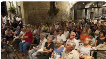
El convent de Santa Clara convoca una pregària per la pau DT, 10/10/2023 | REGIÓ 7