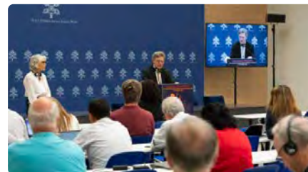
El Sínode prega per la pau a l'Orient Mitjà DV, 13/10/2023