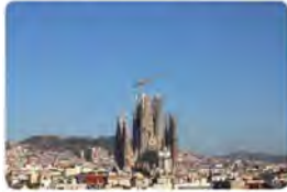
14:54 · 11 d'oct. 23 · 4.528 Visualitzacions

CAT. Anem retirant les bastides de l'Evangelista Mateu i posteriorment serà el torn de Joan! Els terminals de les dues torres van quedant al descobert i ens deixen imatges com aquesta!