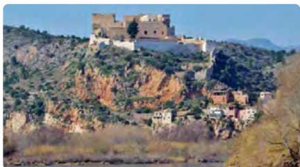
El retorn dels templers? Demanden el Papa i li exigeixen que els rehabiliti 700 anys després DV, 13/10/2023 | CCMA