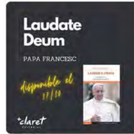
12:01 · 11 d'oct. 23 · 43 Visualitzacions