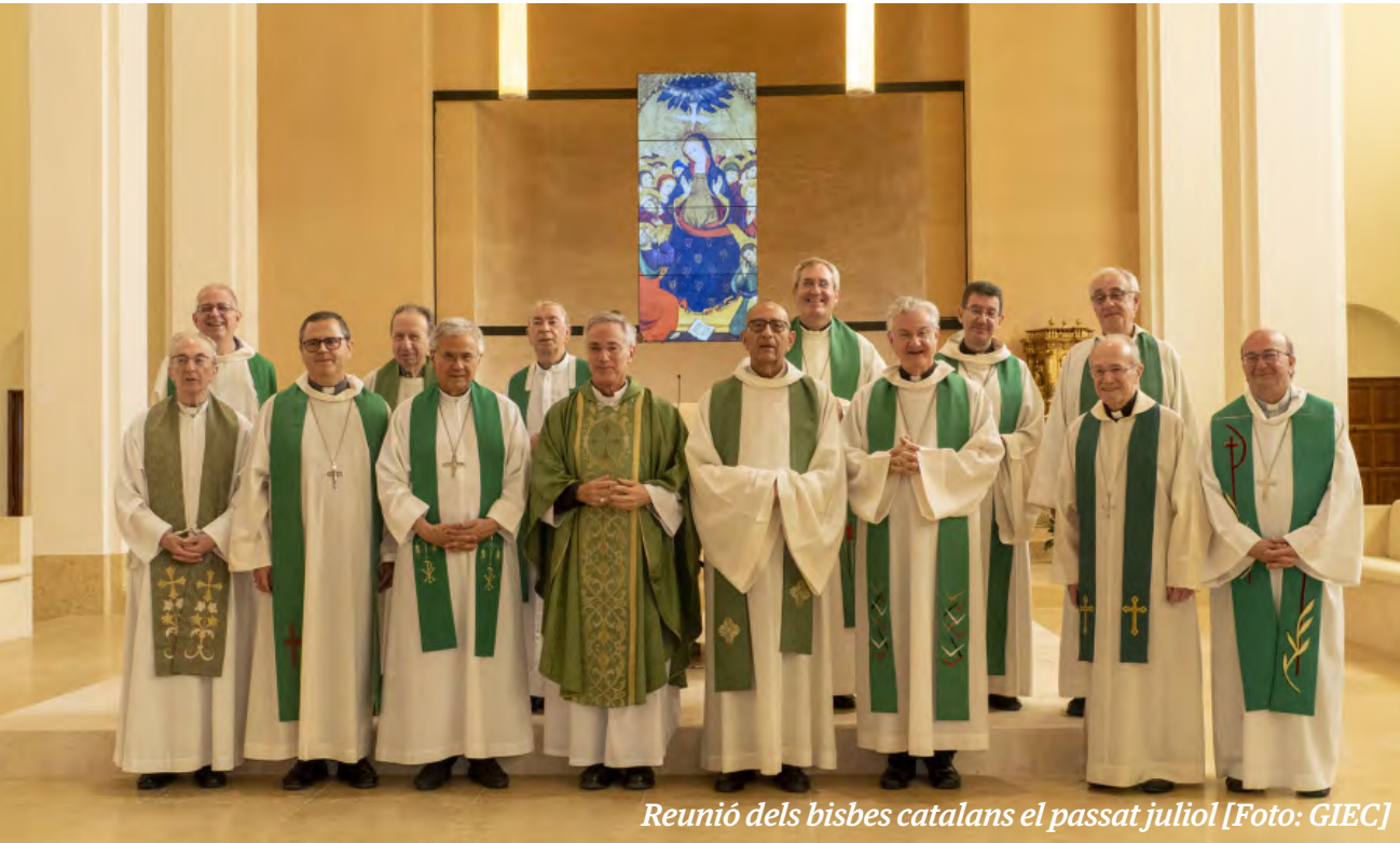
Reunió dels bisbes catalans el passat juliol