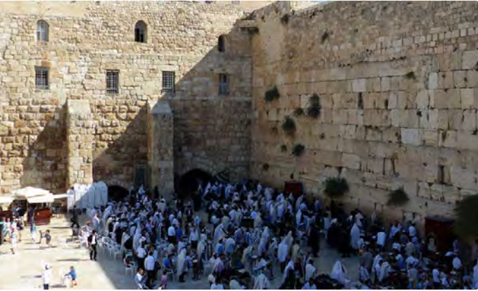
Fotografia: Fidels al Mur de les Lamentacions a Jerusalem