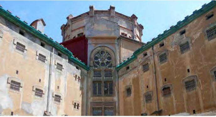
Fotografia: Antiga presó de La Model