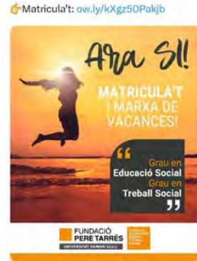
13:30 · 13 de jul. 23 · 102 Visualitzacions

Fundació Pere Tarrés @Fundperetarrés Vols estudiar una professió de futur? T'esperem als graus d'Educació Social i Treball Social de la Facultat Pere Tarrés - URL