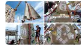
11:23 · 12 de jul. 23 · 3.133 Visualitzacions

La Sagrada Família @sagradafamilia CAT, Ja tenim a lloc el segon dels tres nivells de tambors de la torre de Joan. El pròxim pas és el tercer, som-hi!