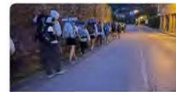
fje.edu El camí de st. Jaume: créixer en valors, profunditat personal i bones amistats | Jesuít...

Camí de Sant Jaume | Una vintena d'alumnes de la xarxa de , vuit d'ells de #JECIoT , han dut a terme aquesta experiència tan enriquidora. Des de l'escola, ens ho expliquen aquí