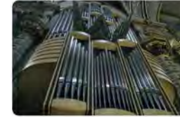
9:36 · 10 de jul. 23 · 389 Visualitzacions

El Festival Internacional Orgue de Montserrat 2023 ofereix nous estils, obres i sons - 11a edició del Fiom, que tindrà lloc els dissabts... #Montserrat #ConcertsMontserrat #FestivalOrgueMontserrat #Notícies #Actualitat #Abadiamontserrat.cat/fiom-2023