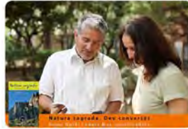
19:02 · 10 de jul. 23 · 192 Visualitzacions