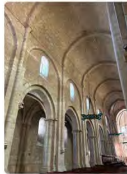
9:59 · 11 de jul. 23 · 490 Visualitzacions

Avui a les 10:00 missa conventual. Per celebrar la Solemnitat del nostre Pare, Sant Benet.