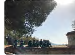
17:54 · 11 de jul. 23 · 560 Visualitzacions

PES Cruïlla - Salesians Sant Jordi @centrecruilla Camp de treball 2023.