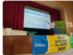
12:24 · 13 de jul. 23 · 197 Visualitzacions

Escoles FEDAC @EscolesFEDAC Ens formem en estratègies amb @DavidGMoratona per crear escoles d'autors #EscolesAutèntiques #avuixdemà