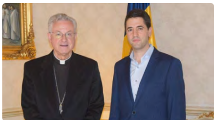
L'arquebisbe Vives rep l'alcalde de la Seu d'Urgell al Palau Episcopal DL, 03/07/2023 | REGIÓ 7