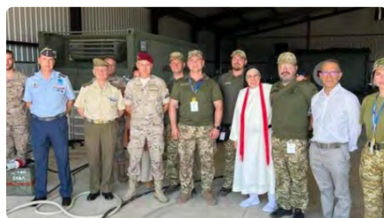
El Ministeri de Defensa dona un hospital de campanya a Ucraïna a través de la Fundació del Convent de Santa Clara DC, 05/07/2023 | REGIÓ 7