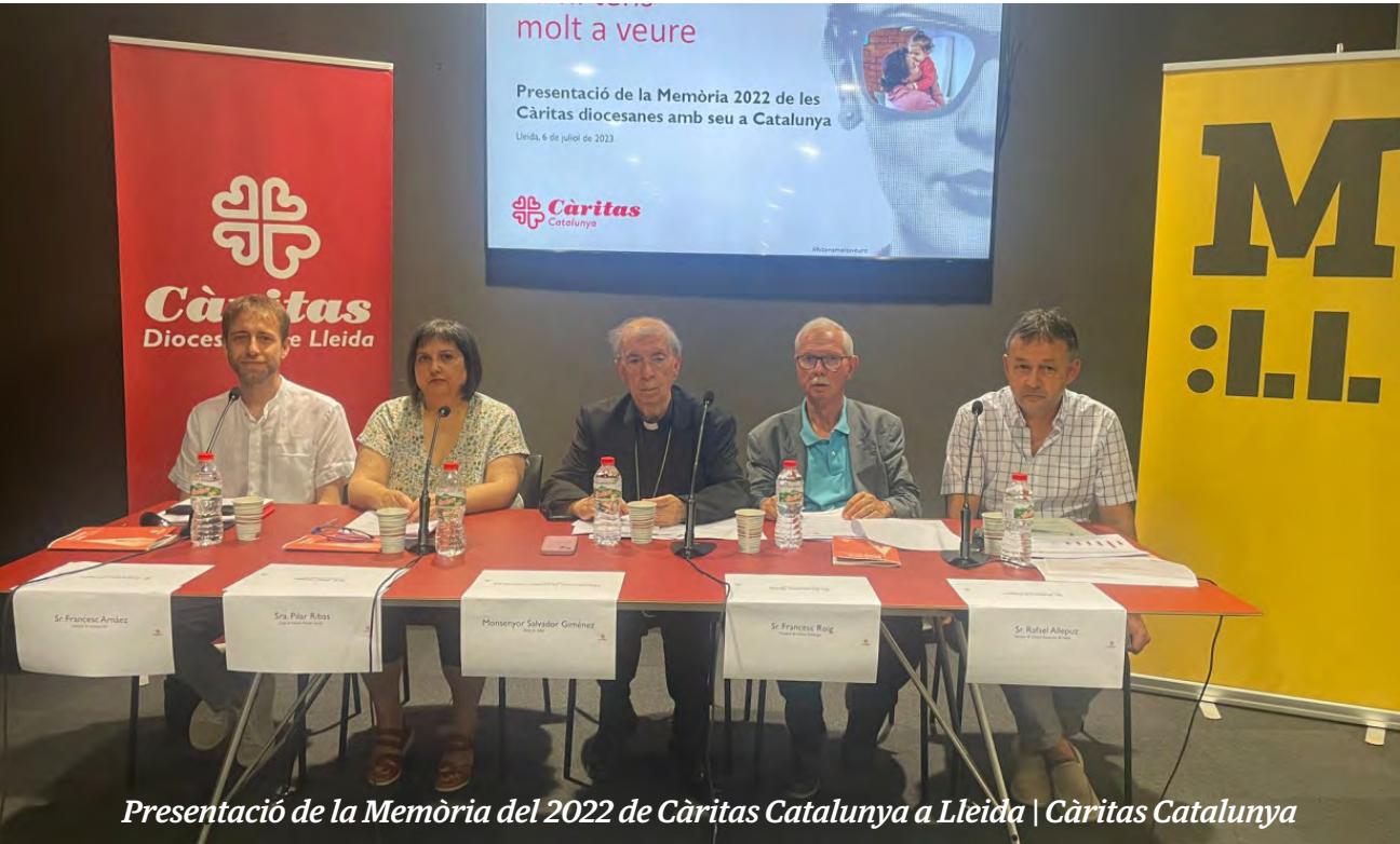
Presentació de la Memòria del 2022 de Càritas Catalunya a Lleida | Càritas Catalunya