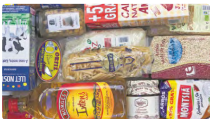
Càritas impulsa la campanya 800x10 per combatre la pobresa a Sant Cugat DC, 05/07/2023 | TOT SANT CUGAT