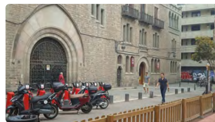
Omella 'intervé' la Fundació Balmesiana i donarà un nou ús al seu edifici DJ, 06/07/2023 | EL PUNT AVUI