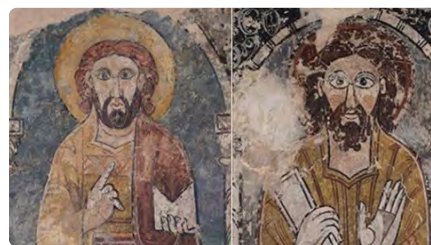
Localitzades sis pintures murals arrencades de tres esglésies del romànic català a mans d'"una col·lecció particular de Suïssa" DC, 05/07/2023 | EL PAÍS