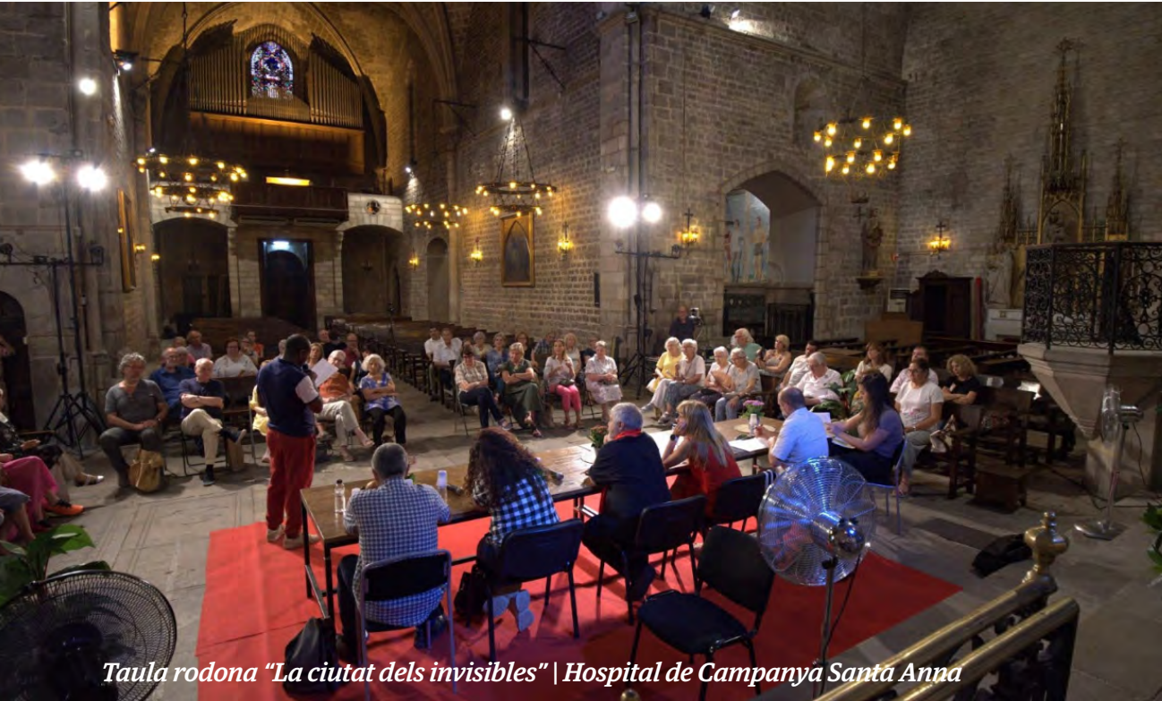
Taula rodona "La ciutat dels invisibles" | Hospital de Campanya Santa Anna