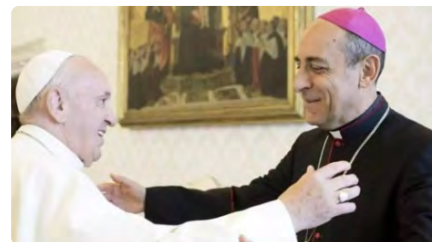
El Papa nomena el seu teòleg de capçalera per acabar amb la Inquisició a l'Església DT, 04/07/2023 | ELDIARIO.ES