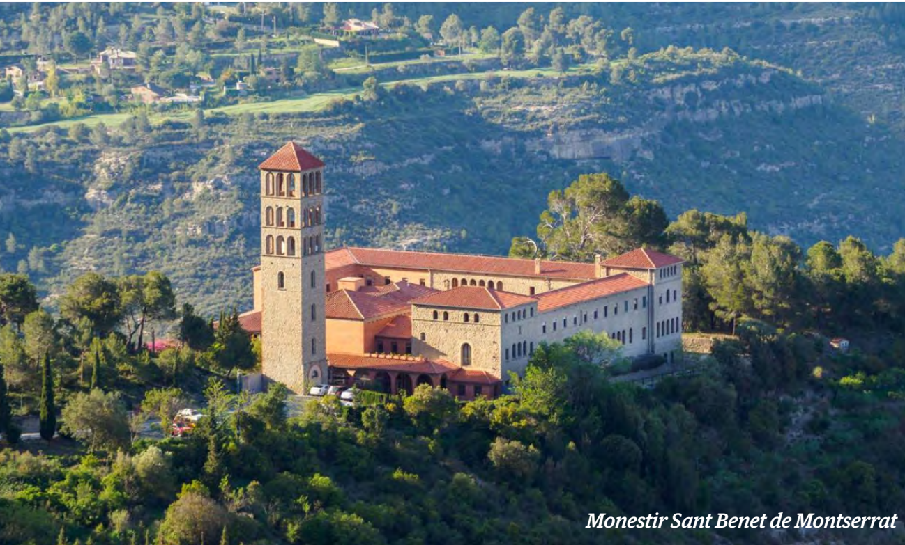
Monestir Sant Benet de Montserrat