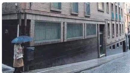
Càritas Manresa s'assegura l'estada al Joc de Pilota cinc anys i Creu Roja compra un local