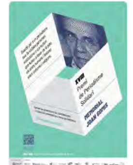
Lola Hierro | 9 més 15:55 - 29 de juny 23 - 179 Visualitzacions