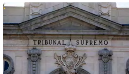
El Suprem avala la perspectiva de gènere i la llibertat religiosa del currículum de primària