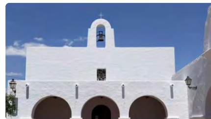
El Museu de Cambrils edita un tríptic sobre la història de les esglésies de Vilafortuny