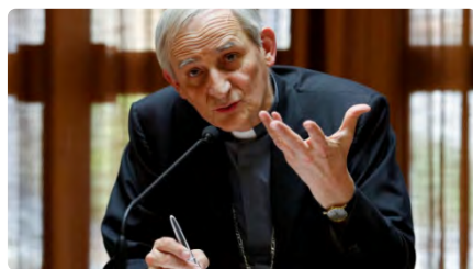
L'enviat del Papa arriba a Moscou per destravar el conflicte a Ucraïna