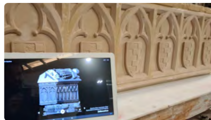
La reproducció del sepulcre del vescomte d'Àger arriba demà al migdia al Monestir de les Avellanes