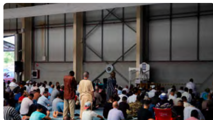
La comunitat musulmana de Lleida ja resa al pavelló 4 de la Fira