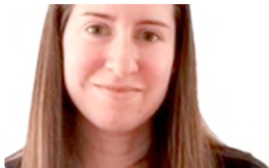
El capellà de 'Masterchef' DL, 19/06/2023 | EL PUNT AVUI