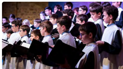
L'Escolania de Montserrat captiva el Monestir de Sant Llorenç DT, 20/06/2023 | REGIÓ 7