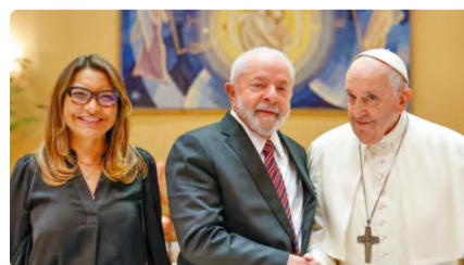
El Papa, al president brasiler Lula: "Estem en temps de guerra i la pau és molt fràgil" DJ, 22/06/2023 | EL PERIÓDICO