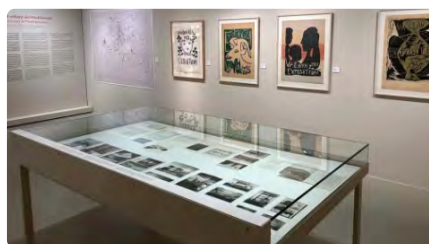
El Museu de Montserrat reprèn les exposicions temporals amb la mostra "Picasso a la donació Busquets" DJ, 22/06/2023 | NACIÓ DIGITAL