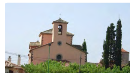
Santpedor programa una visita a Santa Anna i Santa Maria de Claret DV, 23/06/2023 | REGIÓ 7