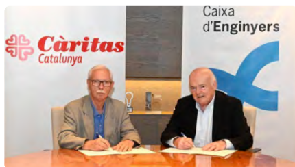
La Fundació Caixa d'Enginyers signa un acord de col·laboració amb Càritas Catalunya DJ, 22/06/2023 | REGIÓ 7