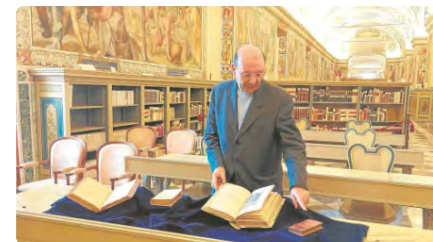
El Vaticà restitueix Blaise Pascal al seu quart centenari DJ, 22/06/2023 | ABC