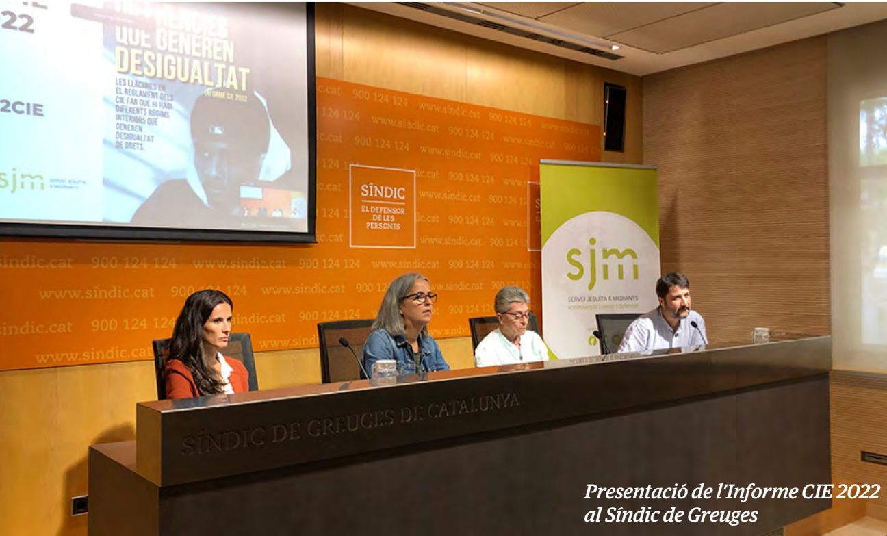
Presentació de l'Informe CIE 2022 al Sindic de Greuges