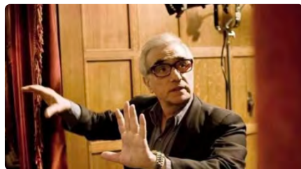
Martin Scorsese afirma que rodarà una pel·lícula sobre la vida de Jesucrist després de reunir-se amb el Papa DC, 31/05/2023 | DIARI ARA