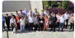
sjd.es Profesionales de San Juan de Dios reflexionan sobre el modelo de atención espiritual en los... 19:45 · 30 may, 23 · 97 Visualitzacions

Sant Joan de Déu CAT @OHSantJoandeDeu Els Serveis d'Atenció Espiritual i Religiosa són fonamentals en l'atenció integral que s'ofereix als centres de Sant Joan de Déu, ja que posen en valor els elements que donen sentit a la vida de cada individu, sobretot en moments de fragilitat.