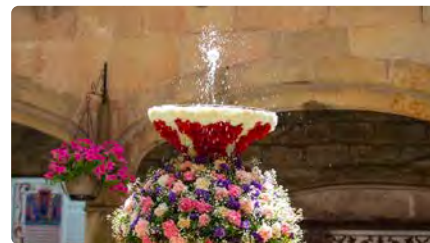
El Corpus de Barcelona convidarà a descobrir els gremis i les confraries DV, 02/06/2023 | TORNAVEU