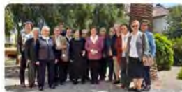
Tú y 6 más 15:50 · 29 may, 23 · 201 Visualitzacions

Unió de Religiosos de Catalunya @ReligiososCat "Trobar-nos és motiu d'alegria i ens permet enfortir els nostres vincles i fer camí d'inter-congregacionalitat des del carisma propi de cada família religiosa."