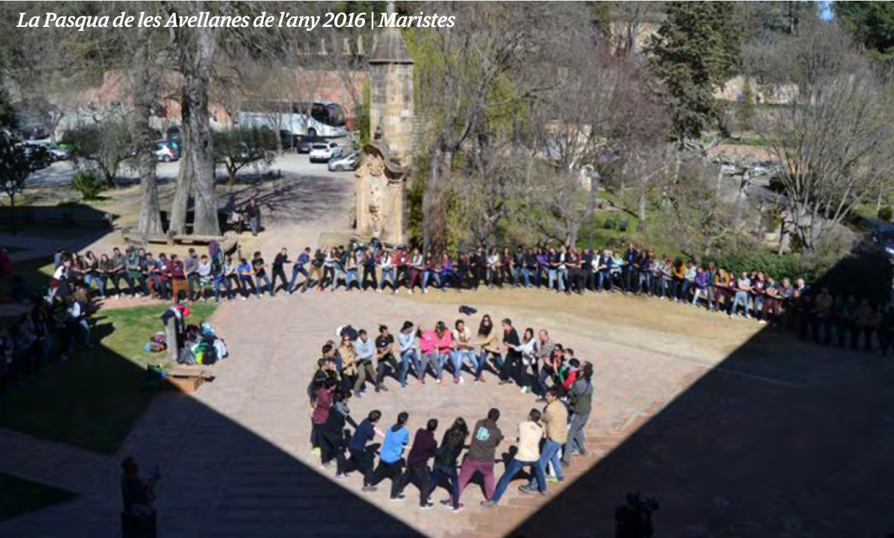
La Pasqua de les Avellanes de l'any 2016 | Maristes

“La Pasqua de les Avellanes ha marcat la forma d’acompanyar els joves dels Maristes”