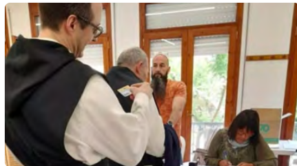
Els monjos de Poblet també exerceixen el seu dret a vot DL, 29/05/2023 | INFO CAMP