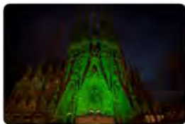
10:21 · 01 jun, 23 · 1.692 Visualitzacions

La Sagrada Família @sagradafamilia CAT. Demà, Dia Internacional de la Miasitènia, donem suport a l'@AMESMIASTENIA per donar a conèixer aquesta malaltia considerada minoritària amb la il·luminació de la façana del Naixement de color verd entre les 21 h i mitjanit