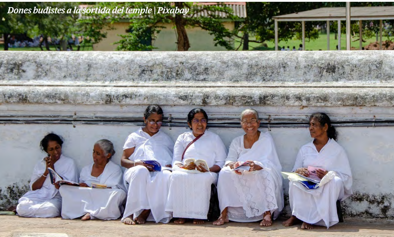
Dones budistes a la sortida del temple

“Les dones budistes sense res a perdre hem creat un atrevit moviment per la igualtat”