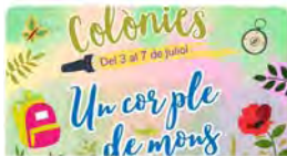
escoles.fedac.cat Inscripcions obertes a les colònies d'estiu CREC - FEDAC 16:18 · 29 may, 23 · 237 Visualitzacions

Escoles FEDAC @EscolesFEDAC Ja us heu apuntat a les #colòniesCREC? Recordeu: 9 de juny, data límit d'inscripció a les #colònies dels #GrupsCREC! Del 3 al 7 de juliol gaudirem de l'#educacióenlleure, l'amistat i l'estiu a Calafell! #EscolesAutèntiquesxPersonesUniques