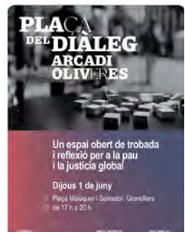
Fons Català Cooperació y 2 más 12:23 · 31 may, 23 · 450 Visualitzacions