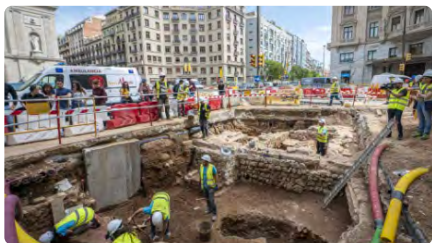
Les obres a Via Laietana troben unes tombes que podrien ser dels primers bisbes de la ciutat DC, 31/05/2023 | EL PERIÓDICO