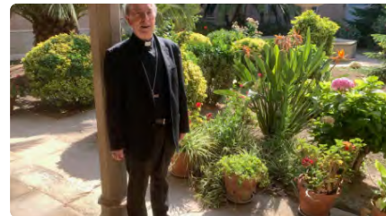
El bisbe Giménez comunica al Papa que ha arribat a l'edat per jubilar-se DC, 31/05/2023 | BISBAT DE LLEIDA