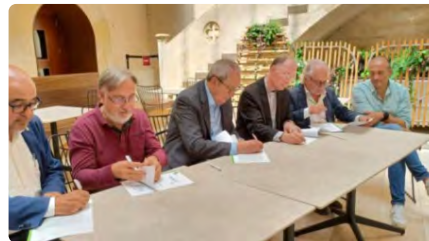
Vilafranca continuarà la catalogació del fons bibliogràfic de mossèn Trens DT, 30/05/2023 | LA CIUTAT