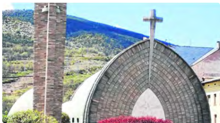
L'església del Pont de Suert serà monument històric DG, 28/05/2023 | SEGRE.COM