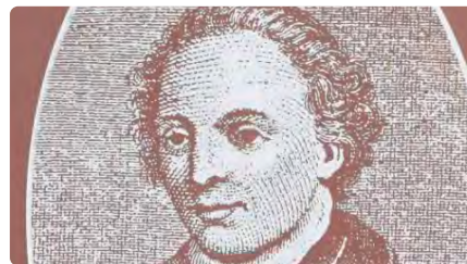
El Rector de Vallfogona arriba a les llibreries en una edició històrica després de 300 anys sense haver-se publicat DJ, 01/06/2023 | DIARI ARA