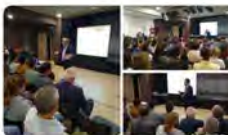
17:21 · 18 may. 23 · 378 Visualizaciones

Escola Pia Catalunya @escolapiacat Aquest dissabte tindrà lloc la #JornadaRecerca de l'Escola Pia de Catalunya a l'@EscolaPiaMoia. Un espai de trobada on posar en comú les recerques, en l'àmbit de la història, del patrimoni, de l'art o la pedagogia en relació amb l'Escola Pia i la figura de Josep Calassanç.