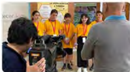
Recerca i Universitats 9:13 · 18 may. 23 · 232 Visualizaciones