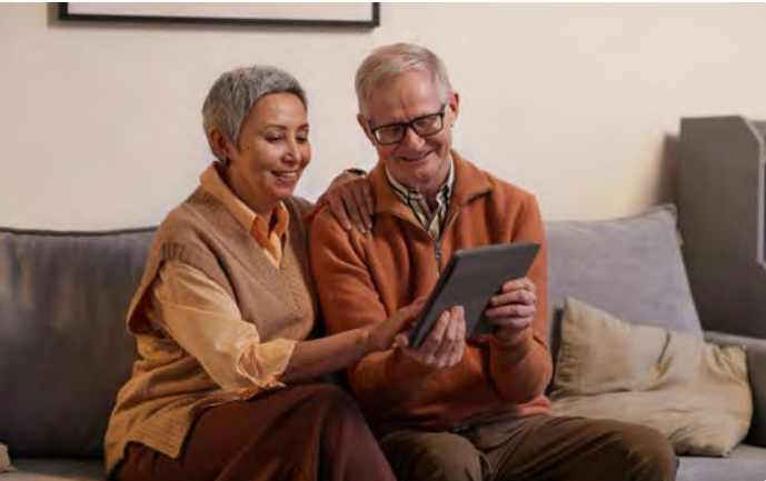
Una parella lingüística