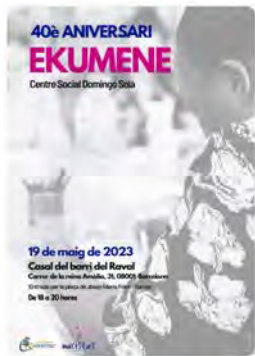
8:24 · 19 may. 23 · 87 Visualizaciones

Abadia de Montserrat @montserratinfo Últimes places a l'@Escolaniamont!!!! #Escolaniamontserrat #Montserrat