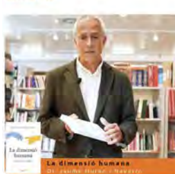
10:01 · 19 may. 23 · 14 Visualizaciones