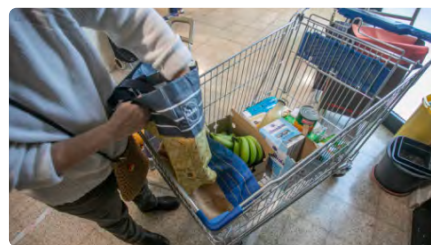
Càritas demana polítiques contra la pobresa i l'exclusió social DV, 19/05/2023 | EL PUNT AVUI