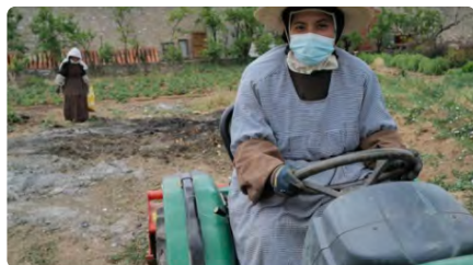
Convents a la recerca de la caritat: "Ens sentim necessitades" DL, 15/05/2023 | ABC