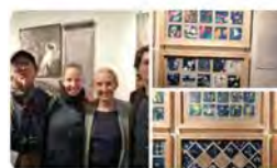
20:46 · 18 may. 23 · 131 Visualizaciones