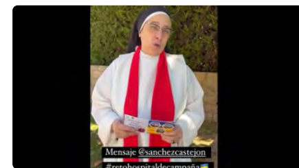
Sor Lucia demana ajuda a Pedro Sánchez per fer realitat la compra d'un hospital de campanya a Ucraïna DV, 19/05/2023 | REGIÓ 7