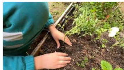
Ecoparròquies, les comunitats eclesials contra el canvi climàtic DT, 16/05/2023 | TV3