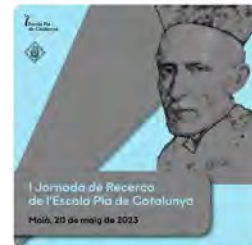
22:01 · 17 mar. 23 · 314 Visualizaciones

Justícia i Pau @JusticialPau I Mostra d'art descaçer oer la terra @JusticialPau amb obra col·lectiva de l'IES Puig Castellar de Sta Coloma, IES Nou Barris, IES Castellar del Vallès. Cianotípies amb tècniques mixtes @Bcn @NouBarris @noubarris @SOMgramenet @GramenetTv @ateneu9b