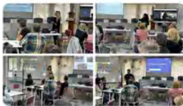
13:48 · 17 may. 23 · 237 Visualizaciones