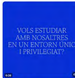
17:29 · 16 may. 23 · 991 Visualizaciones

Abadia de Montserrat @montserratinfo Últimes places a l'@Escolaniamont!!!! #Escolaniamontserrat #Montserrat