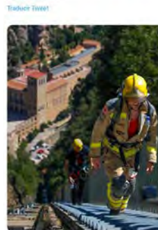
Vertical Montserrat: y 8 más 9:45 · 19 may. 23 · 103 Visualizaciones