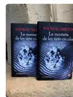
15:26 · 16 may. 23 · 278 Visualizaciones

Monestir de Poblet @MonestirPoblet Ja disponible a la botiga del @MonestirPoblet La muntanya de los siete círculos, de l'escriptor catòlic estatunidenc Thomas Merton.