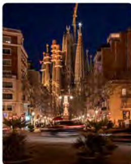
10:38 · 12 may. 23 · 11,1K Visualizaciones

EN_ Beautiful night-time shots of the Sagrada Família!