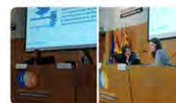
IQS y Oscar Mateos 13:57 · 12 mar. 23 · 633 Visualizaciones

Monestir de Poblet @MonestirPoblet Ja disponible a la botiga del @MonestirPoblet La muntanya de los siete círculos, de l'escriptor catòlic estatunidenc Thomas Merton.