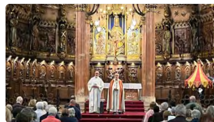
La Catedral de Terrassa acull una nova Pregària per la Pau, amb la guerra d'Ucraïna de rerefons DV, 19/05/2023 | TERRASSA DIGITAL