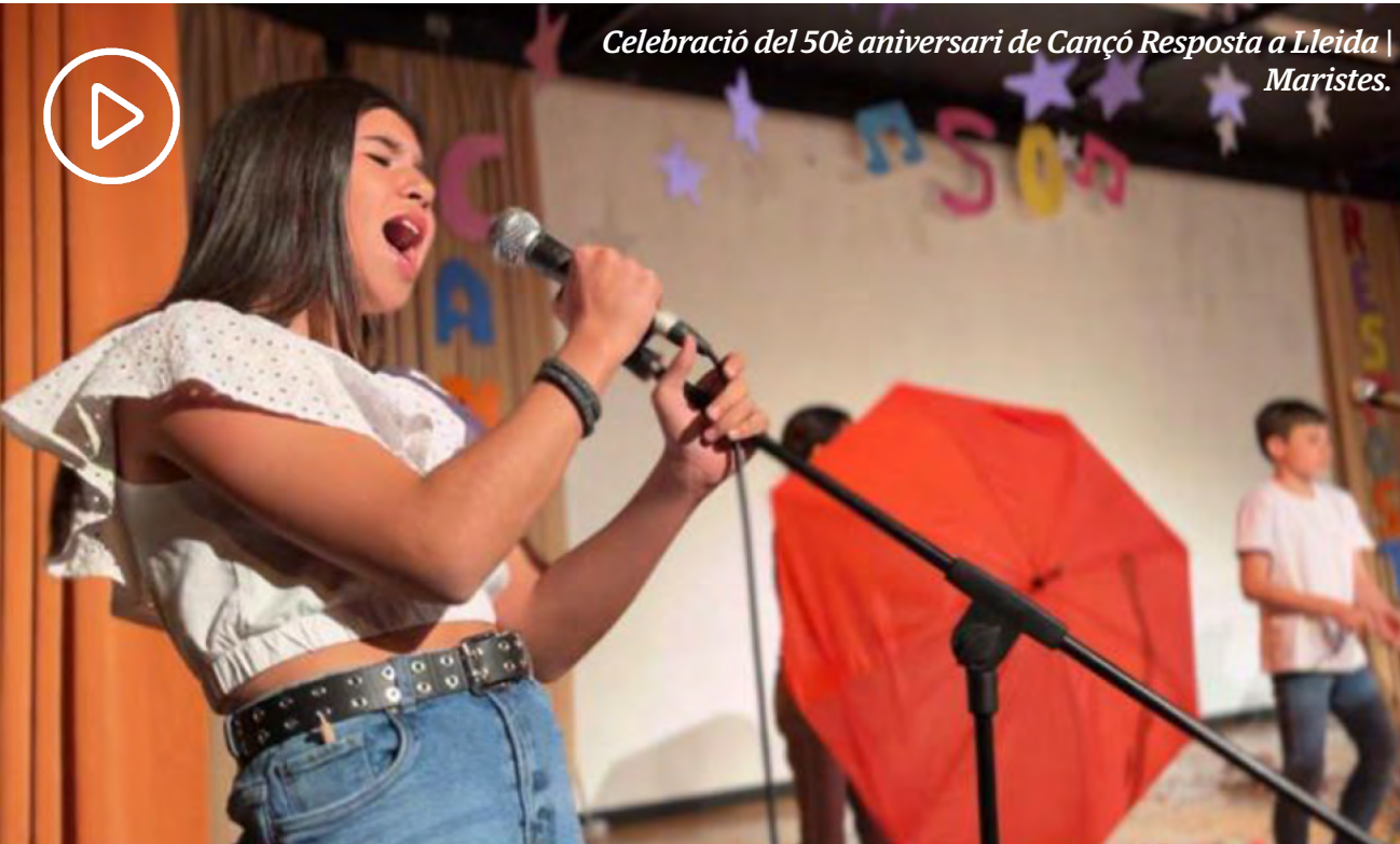
Celebració del 50è aniversari de Cançó Resposta a Lleida | Maristes.