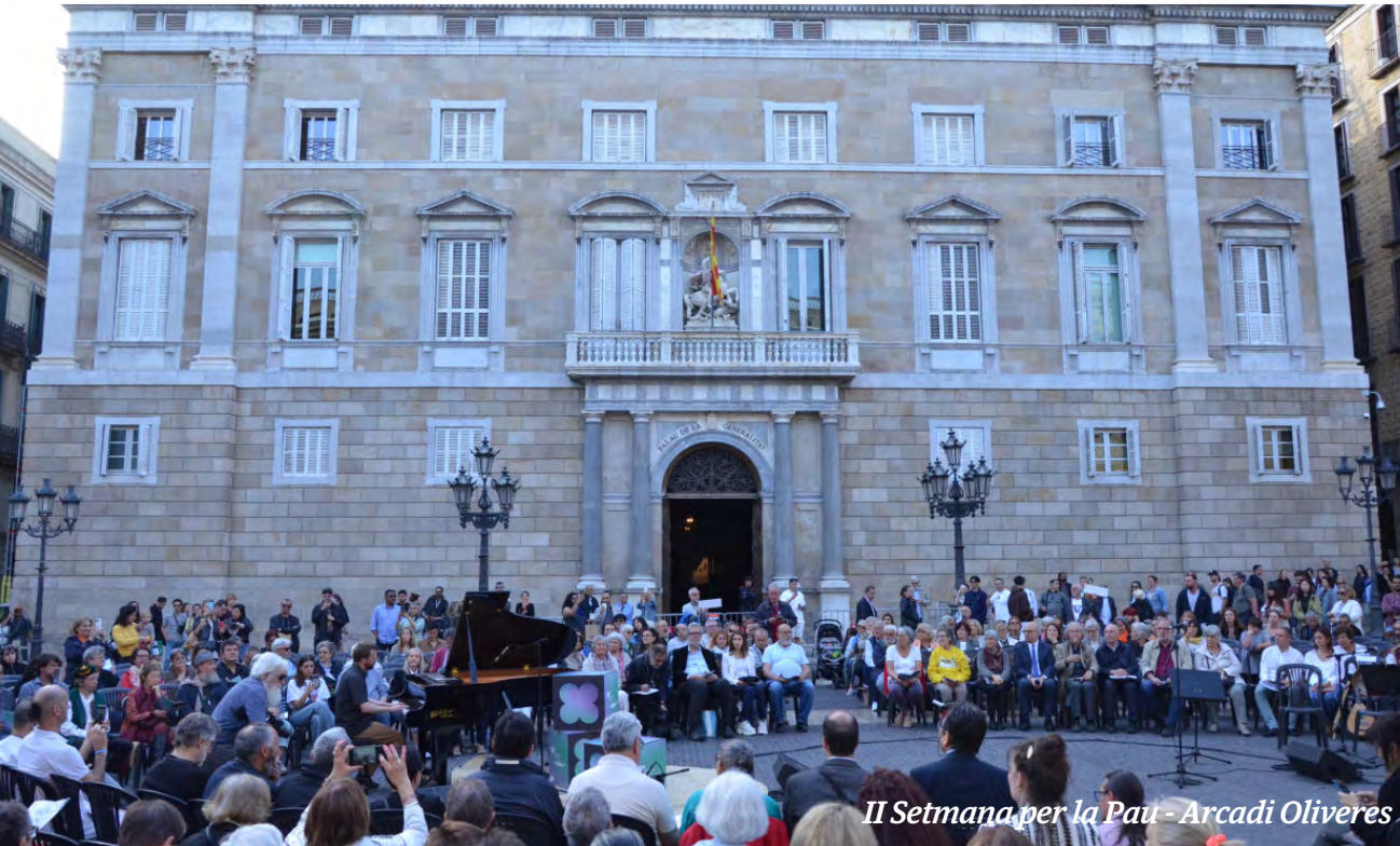
II Setmana per la Pau - Arcadi Oliveres