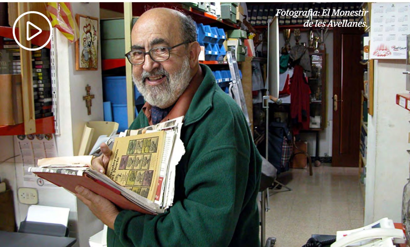
Fotografia: El Monestir de les Avellanes.