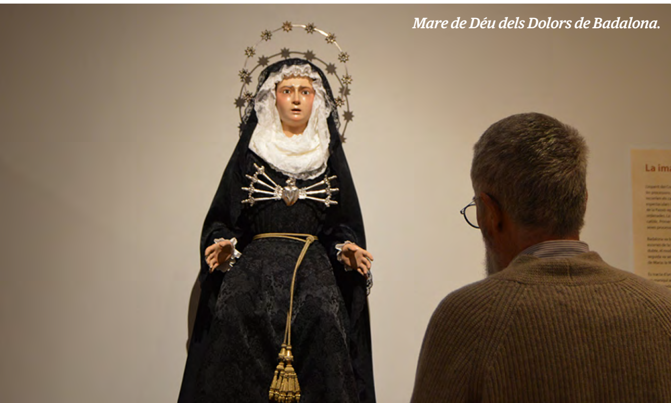
Mare de Déu dels Dolors de Badalona.