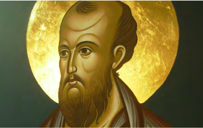
Fotografia: Icona de Sant Pau del taller d'iconografia de Barcelona