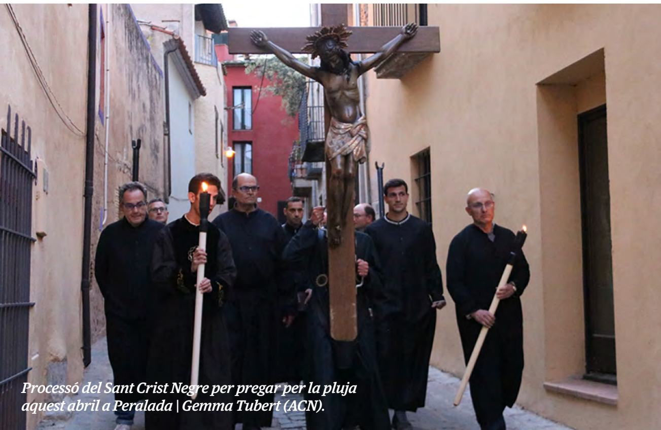
Processó del Sant Crist Negre per pregar per la pluja aquest abril a Peralada