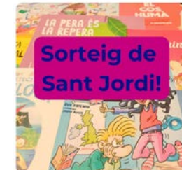
17:42 · 20 abr. 23 · 121 Visualizaciones

Maristes Catalunya @MaristesCat Ens agraden els llibres... 📖👉👈 Per això hem preparat un sorteig molt especial on podreu guanyar un lot de llibres infantils gràcies a @baula_editorial! Podeu consultar les bases completes del concurs al compte d'IG @maristescat Molta sort! Traducir Tweet