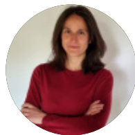
LAURA MOR A SOLVITUR AMBULANDO

Es pot passar de la invisibilitat, al reconeixement. Del menyspreu i la violència, al respecte. Del silenci, a la paraula. Les dones que van viure la passió i resurrecció de Jesús tenen coses a dir. Les hem sentit aquest diumenge als jesuïtes del Clot, a l'obra Apassionades . Aquesta comunitat amb llarga tradició pel teatre ha recuperat un clàssic i ho ha fet amb ulls de dona.