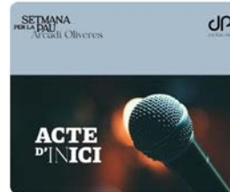
11:00 · 20 abr. 23 · 506 Visualizaciones

04/05 18.30 h Palau Robert Traducir Tweet