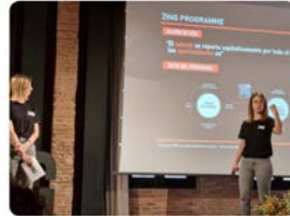
11:05 · 20 abr. 23 · 388 Visualizaciones

Vedruna Catalunya Educació @VedrunaCat Amb la Fundació #NousCims treballem junts en el programa @ZingProgramme perquè "el talent és repartit de manera proporcional a tot arreu; però les oportunitats, no". Avui a la 1a Jornada d'ocupació d'impacte. Donem #oportunitats a joves vulnerables! #escolacompromesa @EdutechCluster Traducir Tweet