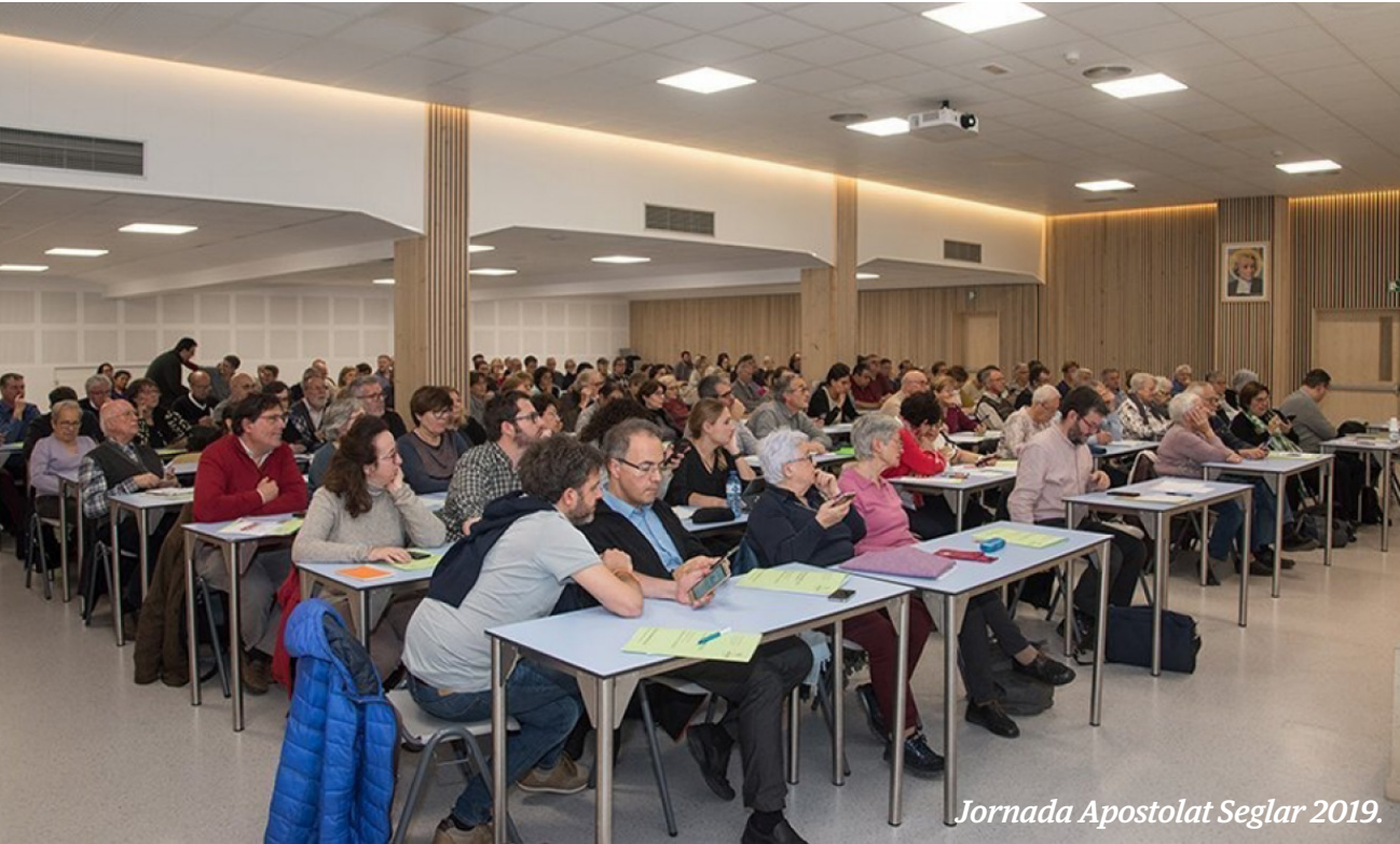
Jornada Apostolat Seglar 2019.