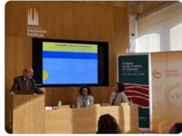
12:21 · 20 abr. 23 · 1.845 Visualizaciones

La Sagrada Família @sagradafamilia CAT. La Sagrada Família presenta les propostes pedagògiques a la Confederació Cristiana d'Associacions de Pares i Mares d'Alumnes de Catalunya @AMPASCCAPAC Més informació: sagradafamilia.org Traducir Tweet