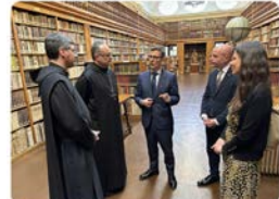
19:49 · 20 abr. 23 · 303 Visualizaciones

Abadia de Montserrat @montserratinfo El ministre de la Presidència, Félix Bolaños, visita Montserrat - Dijous 20 d'abril, el ministre de la Presidència... #Montserrat #Notícies #Actualitat abadiamontserrat.cat/el-ministre-de... Traducir Tweet