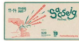
13:29 · 17 abr. 23 · 597 Visualizaciones

Solidaritat Sant Joan de Déu @solidaritatsjd Neix el #FestivalSacseig, una nova proposta anual d'arts escèniques organitzat per l'Obra Social de Sant Joan de Déu i @utopiabcn amb l'objectiu de "sacsejar" la societat per transformar-la, i comptem amb tu per fer-ho! festivalsacseig.org Traducir Tweet