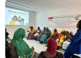
13:00 · 19 abr. 23 · 101 Visualizaciones

Jesuïtes Catalunya @jesuïtescat Al Senegal, un projecte que compta amb el suport del Secretariat de Missions de la Companyia de Jesús, acompanya en processos de dol persones marcadament pel dolor que provoquen les morts i desaparicions al mar i en els trajectes migratoris. ow.ly/1KY650NIZNa Traducir Tweet