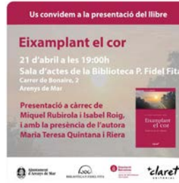
19:01 · 20 abr. 23 · 35 Visualizaciones

Llibreria Claret @LlibreriaClaret Demà a la tarda us convidem a la presentació del llibre Eixamplant el cor, de l'autora M.Teresa Quintana. Us esperem, a les 19h, a la sala d'actes de la Biblioteca Pare Fidel Fita, d'Arenys de Mar. claret.cat/actividad/3977... Traducir Tweet