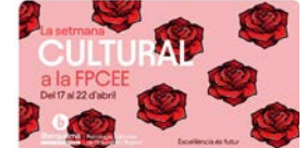
11:46 · 20 abr. 23 · 485 Visualizaciones

Blanquerna FPCEE @BlanquernaFPCEE Celebrem a la Facultat la #SetmanaCultural, amb diversos actes previstos. A les 12 h tindrà lloc a l'Auditori l'acte de lliurament dels Premis #SantJordi2023, on us hi esperem a tots i totes! Traducir Tweet