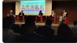
10:47 · 19 abr. 23 · 462 Visualizaciones

Escoles FEDAC @EscolesFEDAC Som a #EdTechCongressBcn23! @ModestJou participa en un diàleg amb el prof. @YongZhaoEd sobre els reptes actuals de l'escola: personalització de l'aprenentatge, el valor de la diversitat i la creativitat, el paper de la intel·ligència artificial, etc. @EdutechCluster #avuidemà Traducir Tweet