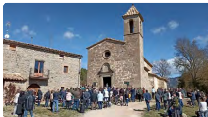
La sequera reviu les rogatives: què és aquesta tradició per demanar que plogui? DL, 27/03/2023 | TV3