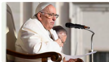
Millora la salut del Papa i podria ser donat d'alta en els pròxims dies DV, 22/03/2023 | VATICAN NEWS