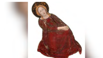
El Monestir de Pedralbes crea uns "stickers" amb pintures de la capella de Sant Miquel DV, 31/03/2023 | BETEVÉ