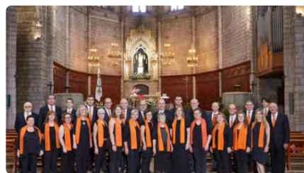
Cardona inaugura la commemoració del 600 aniversari de la imatge de la seva patrona DV, 31/03/2023 | REGIÓ 7