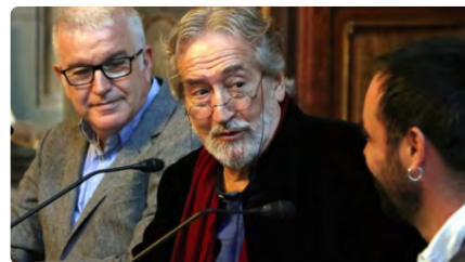
La tercera edició del Festival Jordi Savall estarà dedicada a la vida, la dona i la natura DC, 29/03/2023 | REVISTA MUSICAL CATALANA