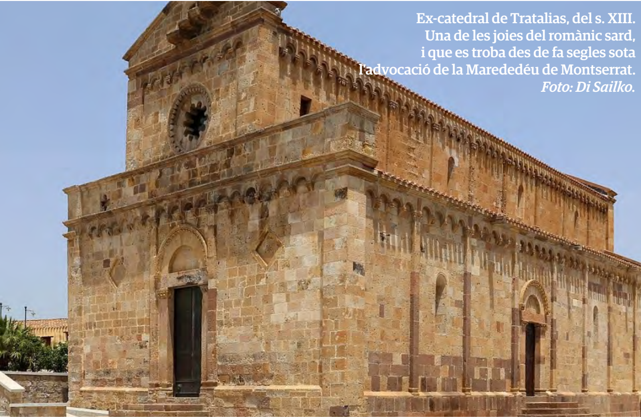
Ex-catedral de Tratalias, del s. XIII. Una de les joies del romànic sard, i que es troba des de fa segles sota l'advocació de la Marededéu de Montserrat.

L'illa de Sardenya és, sens dubte, un dels territoris amb major presència montserratina fora de la península Ibèrica. L'origen d'aquesta devoció va vinculada, lògicament, a la llarga presència catalana en aquesta illa, sobretot a partir del s. XIV; però no deixa de ser significatiu que set segles després aquesta continuï tant arrelada i viva. De fet s'hi troben més d'una dotzena de llocs sota l'advocació de la Marededéu de Montserrat, des d'una catedral, passant per diverses parròquies, esglésies, ermites i altars. També hi ha dos municipis que deuen el seu nom directament o indirecta a la patrona de Catalunya, i el 8 de setembre (dia de les marededéu trobades) es celebra la seva festa en diversos indrets, amb processons i altres actes, alguns molt concorreguts. I tot això es fa, en moltes ocasions, sota el seu nom sard: Sa Munserrada.