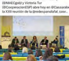
16:23 · 23 mar. 23 · 99 Visualitzacions

Obs Blanquerna @ObsBlanquerna Avui som aquí Traducir Tweet