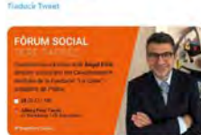
17:05 · 22 mar. 23 · 187 Visualitzacions