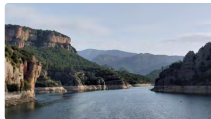
Troben un cadàver a la Llosa del Cavall: podria ser el capellà desaparegut fa mesos al Solsonès DT, 21/03/2023 | RAC1