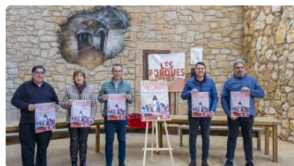
Les escenes de 'La Passió de Crist' tornaran als carrers de Constantí DJ, 23/03/2023 | LA CIUTAT