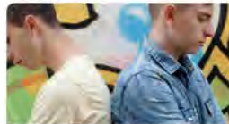
sjd.es Sant Joan de Déu lidera l'atenció en salut mental en l'àmbit penitenciari i de justícia. 12:48 · 22 mar. 23 · 132 Visualitzacions

Sant Joan de Déu CAT @DHSanJoandeDeu El model d'atenció a la salut mental penitenciària a Catalunya, liderat per Sant Joan de Déu, és el més avançat d'Europa. @SaludMentalSJD ha explorat aquest model en el seu monogràfic "L'atenció en salut mental a persones privades de llibertat". Traducir Tweet