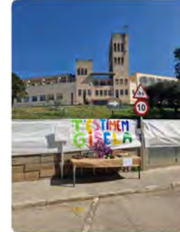
11:35 · 23 mar. 23 · 611 Visualitzacions

Maristes Catalunya @MaristesCat La comunitat marista de Catalunya estem de dol i ens sentim en comunió amb la ciutat de Rubí i amb el col·legi #MaristesRubí. El nostre record i el nostre escalf a les famílies de les tres víctimes de l'incendi mortal a la ciutat. Que la Bona Mare els aculli en els seus braços. Traducir Tweet