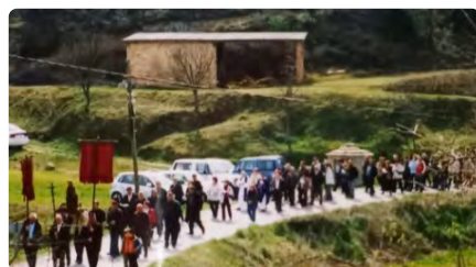
L'última cerimònia litúrgica a Manresa per a l'arribada de pluges es va celebrar l'any 1953 DC, 22/03/2023 | REGIÓ 7