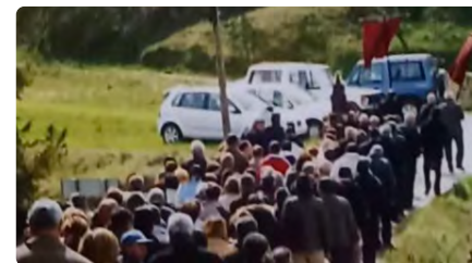
El bisbe de Solsona presidirà una processó al Berguedà per demanar que plugui DC, 22/03/2023 | REGIÓ 7