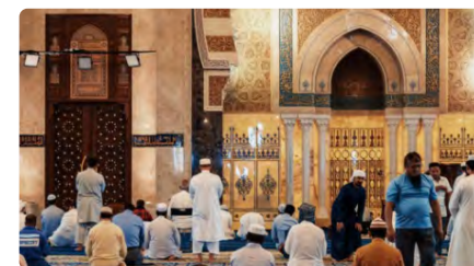
Més de 600.000 musulmans comencen el Ramadà a Catalunya DV, 24/03/2023 | EL NACIONAL