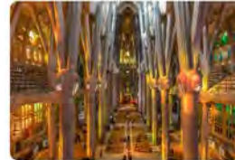
12:52 · 23 mar. 23 · 2.913 Visualitzacions