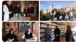
17:32 · 17 mar. 23 · 975 Visualitzacions

Justícia @justiciacat La consellera @emmaubasart signa un conveni de col·laboració entre el Memorial Democràtic (@catmemoria) i l'Arxiu Montserrat Tarradellas i Macià, situat al @ManestriPoble. L'objectiu és cooperar en activitats de recerca, difusió i foment de la memòria democràtica. Traducir Tweet