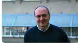
16:01 · 23 mar. 23 · 89 Visualitzacions