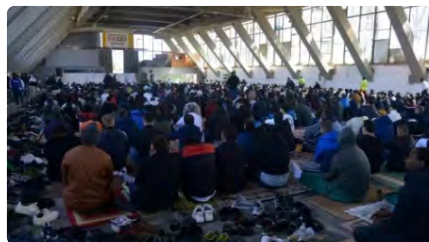
Una de les comunitats musulmanes més gran de Catalunya no troba lloc on resar DL, 20/03/2023 | DIARI ARA