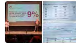
11:56 · 23 mar. 23 · 233 Visualitzacions

Vedruna Catalunya Educació @VedrunaCat Som a Manresa, a la cimera contra l'abandonament escolar prematur. El departament @educaciocat presenta mesures per reduir-lo fins a un 9% l'any 2030 i demana el compromís conjunt de totes les institucions. Traducir Tweet