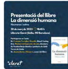
10:01 · 22 mar. 23 · 32 Visualitzacions