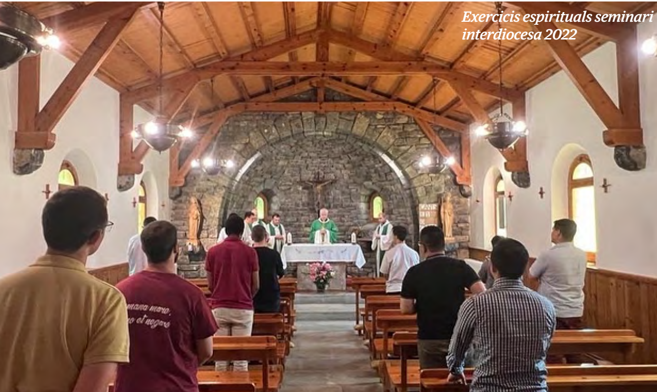
Exercicis espirituals seminari interdiocesà 2022