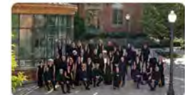
16:41 · 18 mar. 23 · 1.027 Visualitzacions

Abadia de Montserrat @montserratinfo La Coral Sant Jordi interpretarà la Petita Missa Solemne de Rossini en el tradicional Concert de Rams a Montserrat - Patrocinat per la Fundació Salvat, tindrà lloc... #Montserrat #ConcertsMontserrat #Notícies #Actualitat abadiamontserrat.cat/ concert-rams-2... Traducir Tweet