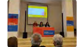
11:24 · 21 mar. 23 · 559 Visualitzacions

Escoles FEDAC @EscolesFEDAC Les #EscolesFEDAC som @escoladelagent! Ens sumen a la campanya de comunicació per donar a conèixer a la societat les 700 escoles d'iniciativa social de #Catalunya, emprenedores, diverses i de qualitat. Traducir Tweet