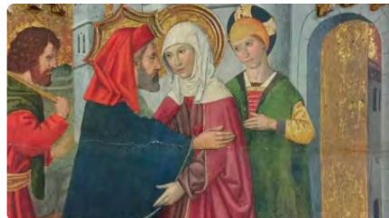
Apareixen noves pintures d'un retaule gòtic desmembrat de Jaume Huguet DJ, 16/03/2023 | ARA