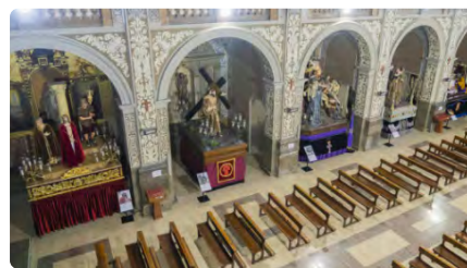
Obren l'espai museïtzat de la Setmana Santa a l'església Sant Agustí de Tarragona DV, 17/03/2023 | DIARI MÉS DIGITAL