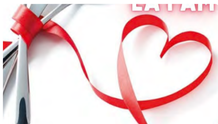
Mans Unides organitza a la Seu d'Urgell una nova edició del Sopar de la fam DV, 17/03/2023 | RÀDIO SEU