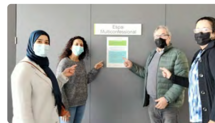
Salut multiconfessional a l'hospital d'Olot DV, 17/03/2023 | EL PUNT AVUI