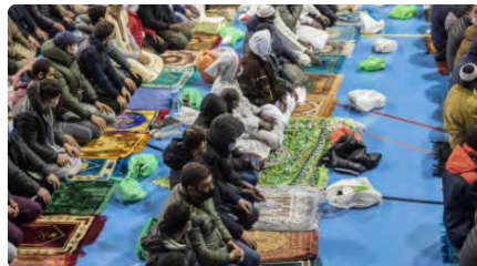
La comunitat musulmana gironina supera per primera vegada les 100.000 persones DC, 15/03/2023 | DIARI DE GIRONA