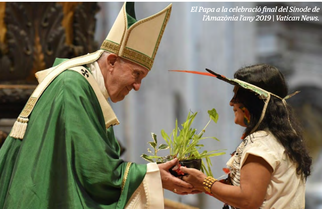
El Papa a la celebració final del Sinode de l'Amazònia l'any 2019