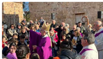
El Bisbat de Terrassa commemora a la Seu d'Ègara els 90 anys de la primera Dominica Laetare DV, 17/03/2023 | TERRASSA DIGITAL