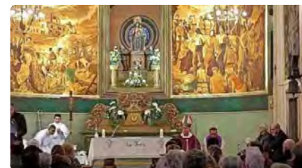
El santuari de Joncadella, de Sant Joan de Vilatorrada, culmina millores al temple amb la restauració de l'altar del Roser DT, 07/03/2023 | REGIÓ 7