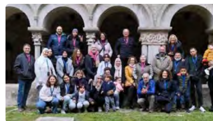
Gironins musulmans trepitgen la Catedral per primera vegada DJ, 09/03/2023 | DIARI DE GIRONA