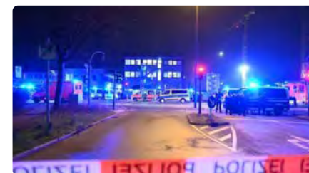
Almenys vuit morts en un tiroteig en un centre religiós d'Hamburg DV, 10/03/2023 | 3/24