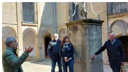
Serrateix rehabilitarà una part del monestir per potenciar el seus usos socials i culturals DL, 06/03/2023 | REGIÓ 7