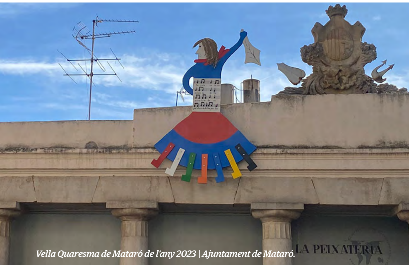
Vella Quaresma de Mataró de l'any 2023