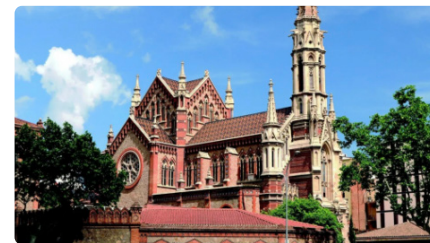
La llibertat religiosa i la interculturalitat a Barcelona, a revisió DV, 24/02/2023 | TORNAVEU