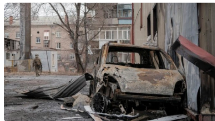
El Papa demana que es posi fi a "l'absurda i cruel" guerra a Ucraïna DJ, 23/02/2023 | VATICAN NEWS