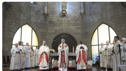
El bisbe de Vic defensa els oficis tradicionals a la missa de la Llum, que ha omplert l'església del Carme DC, 22/02/2023 | REGIÓ 7