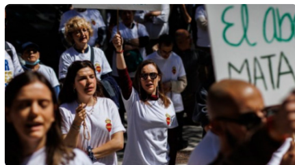
Els antiavortistes, convocats a una missa a la Catedral de Barcelona contra la nova llei DT, 21/02/2023