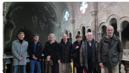
Manresa inverteix 300.000 € per convertir l'antiga església de Sant Francesc en un auditori DV, 24/02/2023 | LA CIUTAT