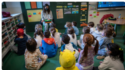
L'escola concertada reivindica a Educació l'educació gratuïta de tot el sistema DJ, 23/02/2023 | EL PERIÓDICO