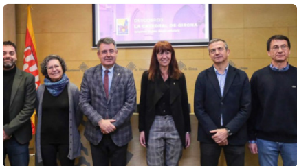
La guia visual de la catedral de Girona ja té versió digital DL, 20/02/2023 | EL PUNT AVUI