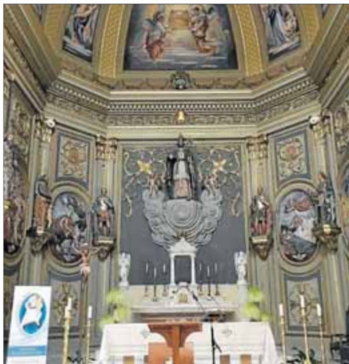
L'altar, amb escultures i pintures.