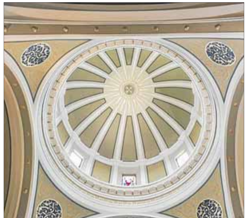
Imatge de la cúpula interior del temple.

L'altar mostra pintures, escultures i relleus sobre el poble i els seus patrons